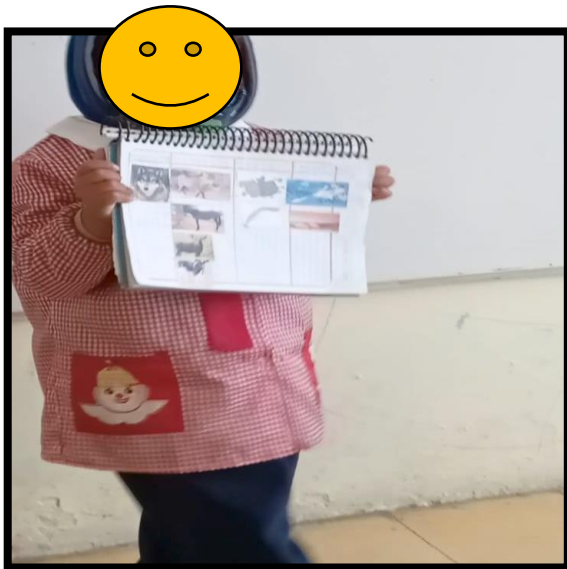
Ilustración 3 Exposición MI MASCOTA alumno del 2º "A" del JN "NIÑOS HÉROES"

Para esta actividad se sugiere realizar el registro en cuadro que contenga las características principales de la mascota como pueden ser: nombre, rasgos físicos, alimentación, lo que hace y llama la atención.