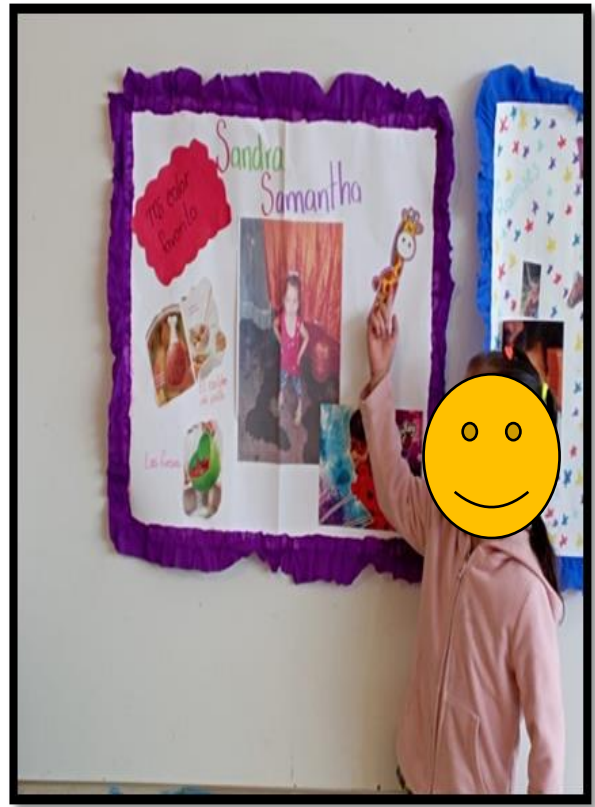
Ilustración 2 Exposición TODO SOBRE MI, alumna del 2º "A" del JN "NIÑOS HÉROES"