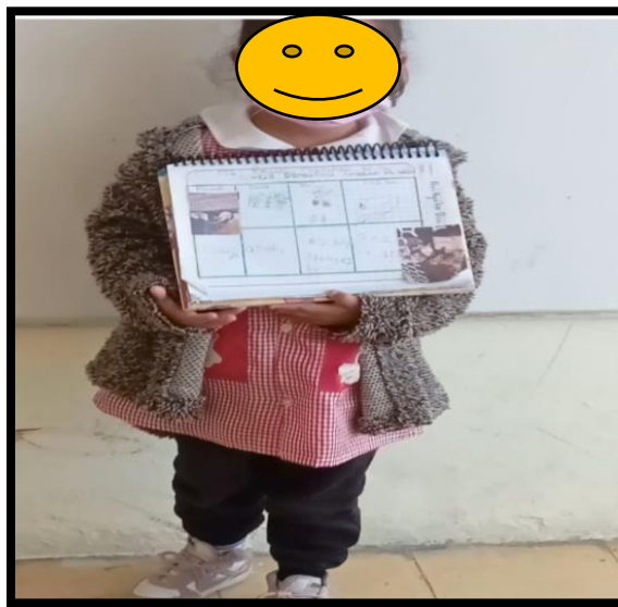
Ilustración 4 Exposición MI MASCOTA alumna del 2º "A" del JN "NIÑOS HÉROES"