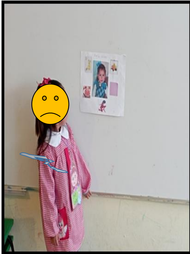
Ilustración 1 Exposición TODO SOBRE MI, alumna del 2º "A" del JN "NIÑOS HÉROES"

Lo anterior se pudo observar cuando niñas y niños interactuaban con el material gráfico, incluido palabras y dibujos les costaba menos trabajo poder comunicar la información.