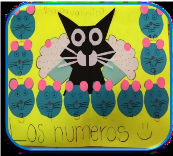
Ilustración 2 Producción en colaboración con la familia del libro de "Los números"