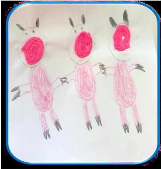
Ilustración 4 Producción del alumno después de escuchar la lectura del cuento "Los tres cochinitos y el lobo."