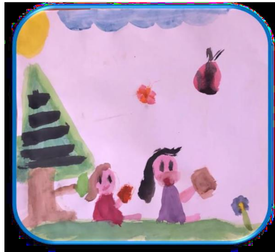
Ilustración 3 Producción del alumno antes de la lectura del libro "Quiero que me cuentes un cuento"