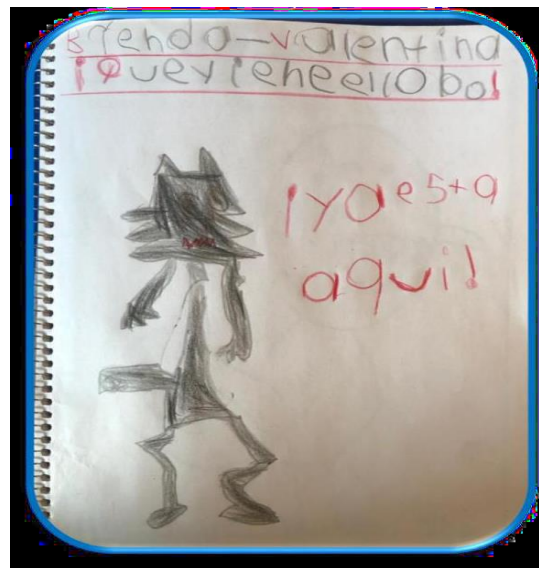
Ilustración 7. Producción gráfica individual del cuento " Que viene el lobo"