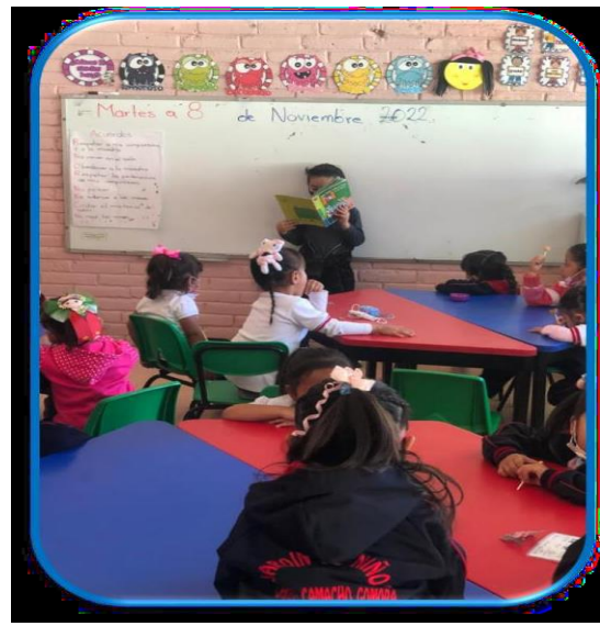
Ilustración 5 Lectura en voz alta del libro "Los siete cabrillos y el lobo" dirigida por un alumno.