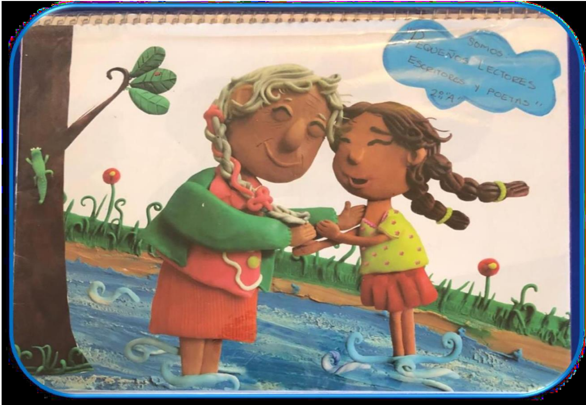
Ilustración 1 Producción de la educadora para la Portada "Libreta viajera"