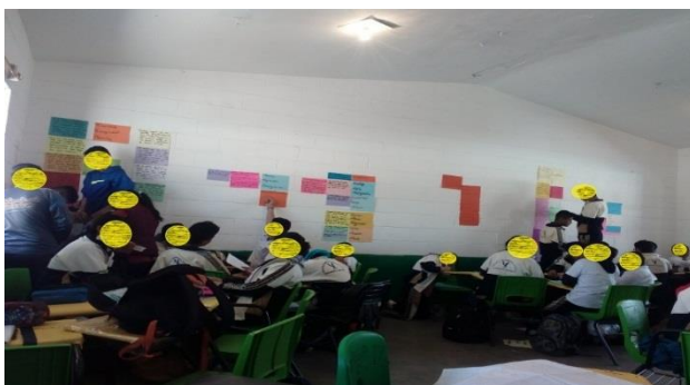
Foto 3. Se desarrolla el trabajo en equipo en el aula, actividad con alumnos de 3°B donde se desarrolla el