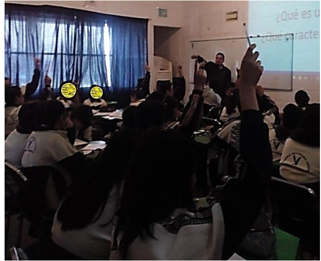
Foto 2. Desarrollo de la sesión en audio visual después de escuchar el cuento el cuento. Grupo de 3°B