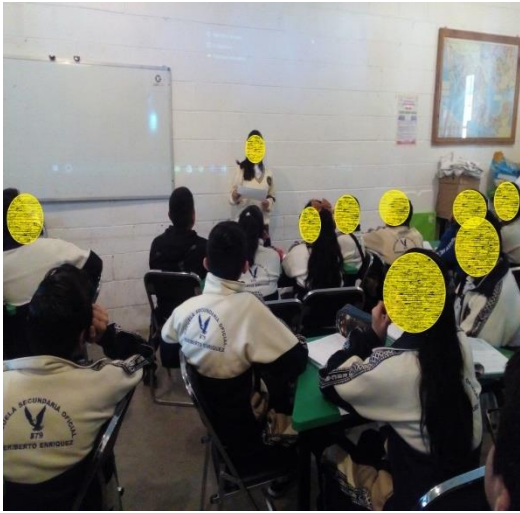
Foto 1. Se trabaja en audio visual antes de escuchar el audio del cuento "Réquiem con tostadas. Grupo de 3°B

Se percataron además que el trabajo colaborativo contribuye a construir aprendizajes ya que lograron en la medida de sus posibilidades contribuir al logro de este objetivo y sobre todo que su relación entre iguales fue de apoyo y de compartir información.