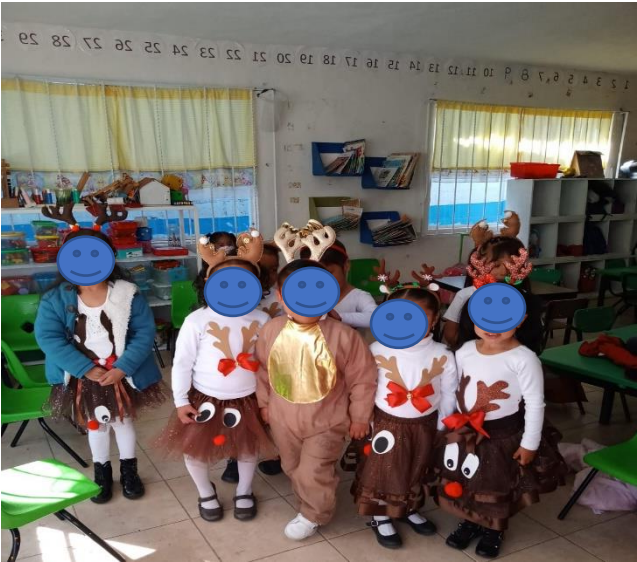
5. Participantes del baile Rodolfo el reno