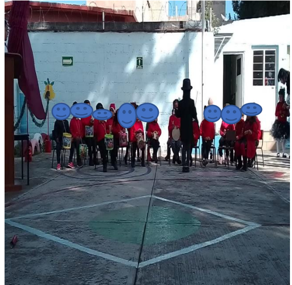
6. Alumnos que integraron la orquesta