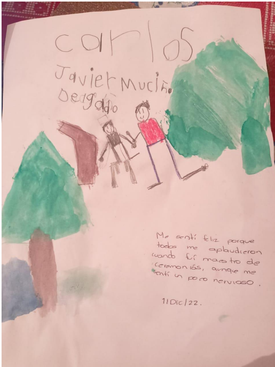
9. Expresión de sentimientos de un alumno al finalizar la actividad