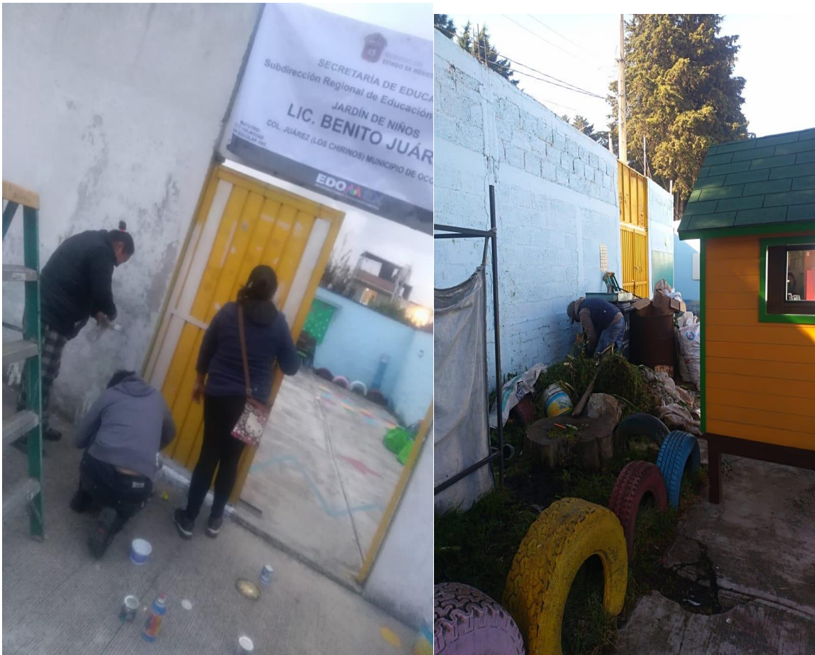
1. Padres de familia colaborando para mejora de la escuela