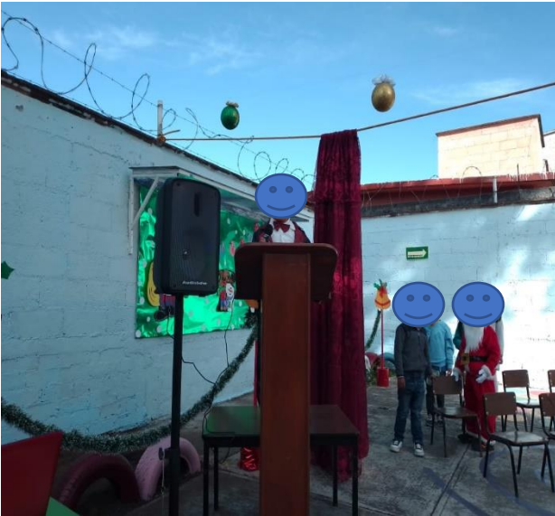
3. Alumno que fue maestro de ceremonias