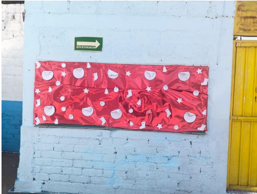
7. Periódico donde padres de familia colocaron sus comentarios