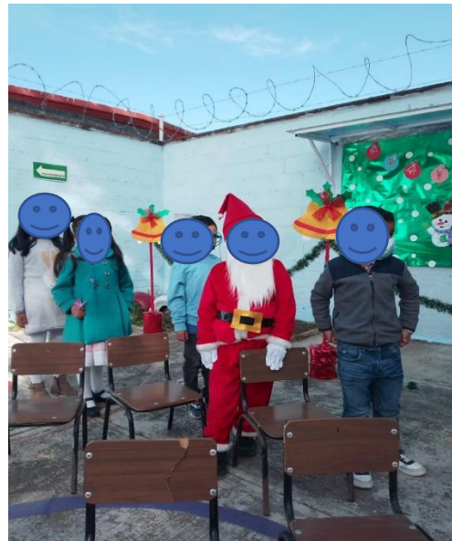
4. Personajes del cuento de navidad