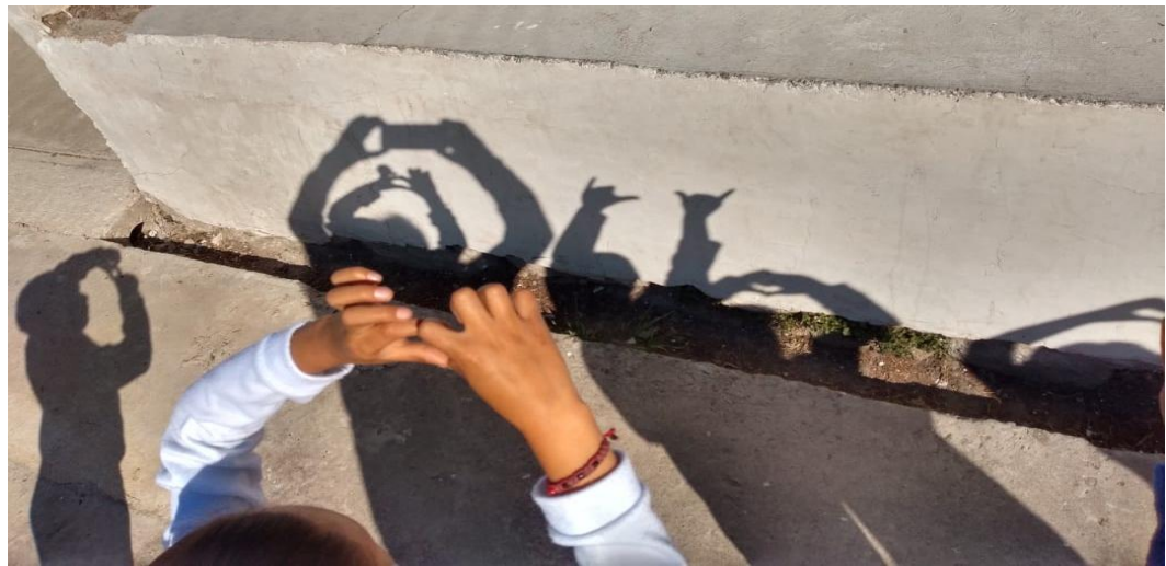
Teatro de sombras

Esc. primaria Venustiano Carranza, San Marcos Tlaxalpan Morelos Edo. Mex.