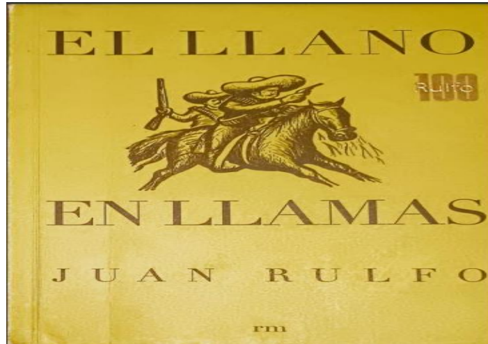
Imagen 1 Portada

Rulfo, J. El llano en llamas (2017). Portada de la obra el Llano en llamas reseñada (Fotografía).