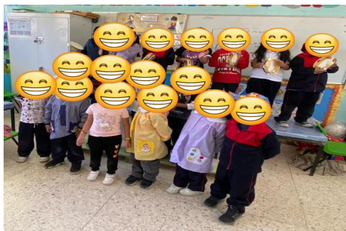
Ilustración 5 Jeimy P. Salazar 2022

Respecto a las sesiones 9 y 10 ya era más claro y evidente sus habilidades respecto al aprendizaje esperado “producir sonidos” pero con una intención pedagógica el entonar canciones haciendo uso de los instrumentos musicales de su interés pues se logró el propósito de formar una orquesta musical y producir sonidos haciendo uso de instrumentos musicales.