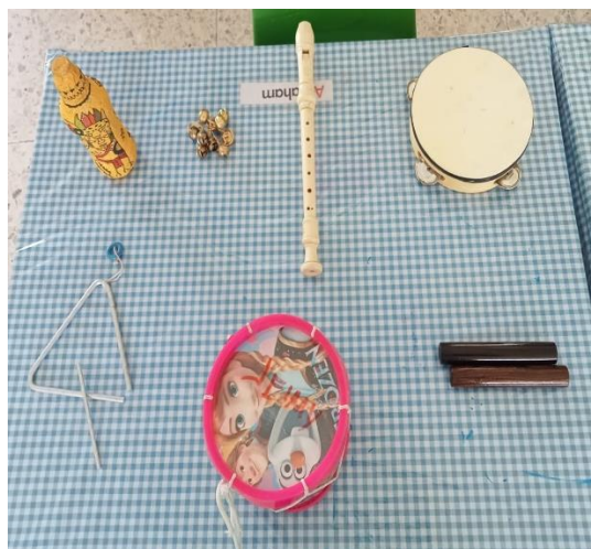
Ilustración 2 Jeimy P. Salazar 2022

Al realizar los juegos con los instrumentos musicales de las sesiones 3 y 4 se observó que en algunos niños no identifican algunos sonidos producidos por ellos, pero después de varios juegos en la identificación y poniendo a prueba sus otros sentidos como el oído y la manipulación lograron ampliar su conocimiento acerca de otros instrumentos y sobre todo manipularlos para saber cómo sueñan.