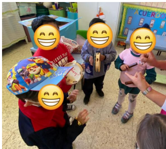
Ilustración 4 Jeimy P. Salazar 2022

Con la manipulación de los instrumentos musicales en la sesión 7 y 8 los niños se enfrentaron a nuevos retos al tener que escuchar con mayor atención para poder marcar un ritmo musical haciendo uso los instrumentos, con la ayuda de otros compañeros este reto se superó en varios niños trabajando como monitores con ellos apoyándolos. Y como resultado de estas actividades se pudieron desarrollar nuevas habilidades como marcar el ritmo musical y al mismo tiempo entonar una canción de su agrado.