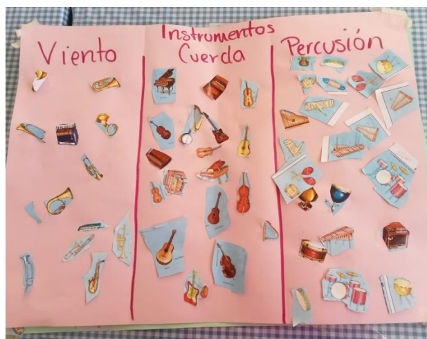
Ilustración 3 Jeimy P. Salazar 2022

En la sesión 5 y 6 los niños mostraron comprensión acerca del tema trabajado ya que al proponerles el reto de clasificar los instrumentos se trabajó la colaboración al elaborar por equipos su cartel comprendiendo las principales características de los instrumentos por sus cualidades. Reto que lograron superar al ordenarlos y compararlos puesto que al evaluar la sesión varios de los alumnos ya al observar los instrumentos del aula mencionaban sus características físicas y nombre formal de cada instrumento.