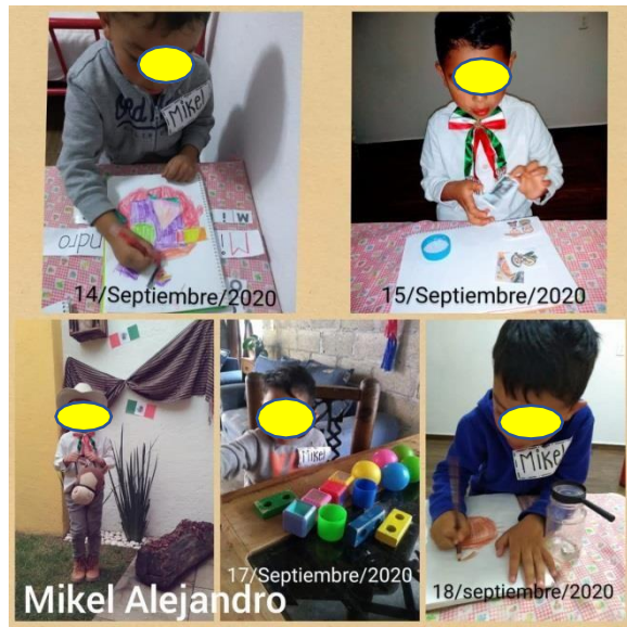
Foto 5 y 6: Evidencias fotográficas compartidas por parte de los padres de familia en relación a las actividades realizadas en una semana.