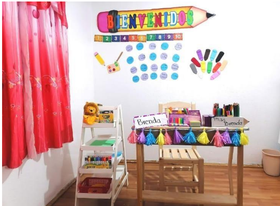
Foto 1: Adecuaciones de espacios en mi hogar para clases a distancia