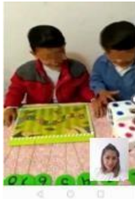
Foto 3 y 4: Videos llamada personalizada a los niños para apoyarlos en la adquisición de su aprendizaje.