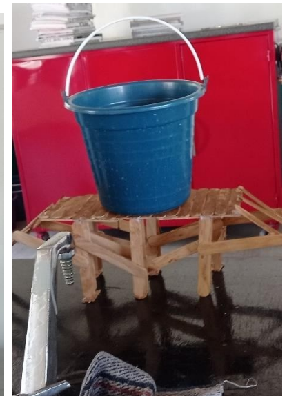
Figura 4. “Prueba 2”. Elaboración propia