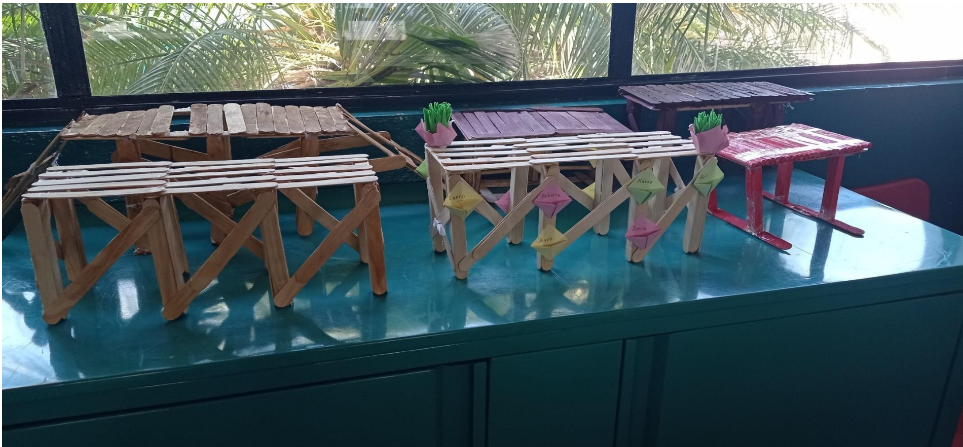
Figura 5. "Los Puentes". Elaboración propia