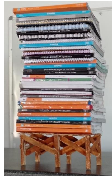
Figura 3. “Prueba 1”. Elaboración propia

El momento más esperado de la presentación fue en poner a prueba la resistencia de la estructura de los puentes, donde en un primer instante se colocaron 10 libros de texto encima del primer puente de la presentación, al notar los estudiantes que lograba resistir fueron colocando más libros y cuadernos hasta llegar a la cantidad de 33 (Figura 3), al notar esta acción se fijó la primer prueba de resistencia con esa cantidad de libros, la segunda prueba fue colocar una cubeta llena con agua (Figura 4), la tercer prueba consistió en soportar el peso de una persona sentada y la prueba que causo mayor conmoción fue la de mantener a una persona en pie de 50 kg durante 10 segundos.