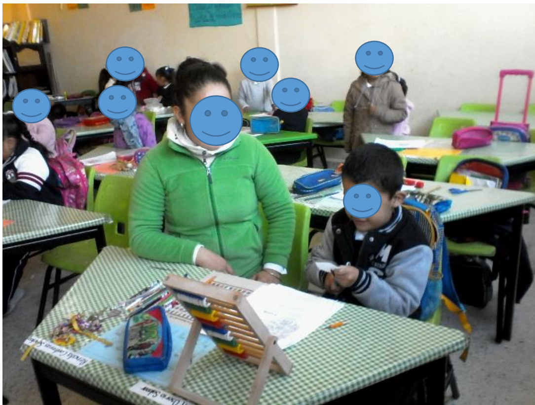
Fotografía N° 12

Nota. Recuperado de Implementación de juegos de mesa en espacios del recreo. L. Bandera