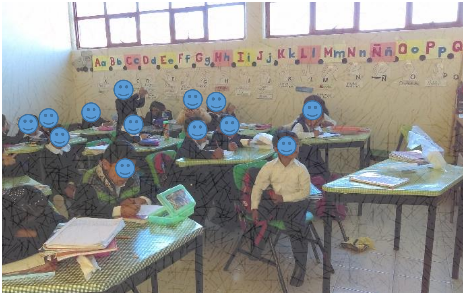
Fotografía N° 7

Nota. Recuperado de Trabajo de vocabulario en LSM con alumnos monitores. L. Bandera