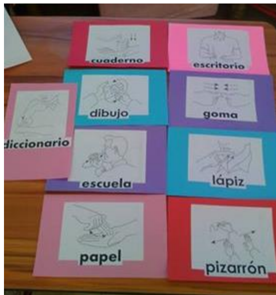
Fotografía N° 15

Nota. Recuperado de Mural de LSM en la escuela Alfredo del Mazo Vélez, en colaboración con padres de familia. L. Bandera