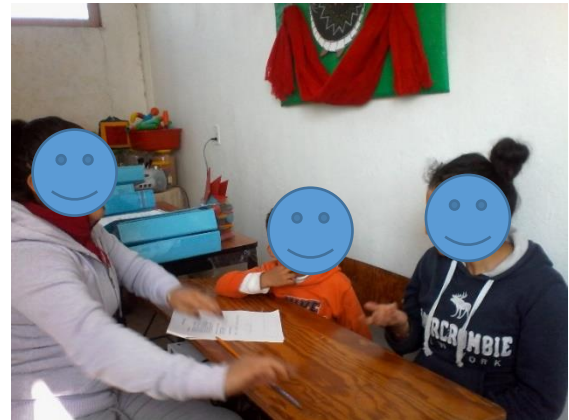
Fotografía N° 10

Nota. Recuperado de Sesión de acompañamiento con alumnos y padres de familia, para brindar apoyo y retroalimentación en casa.