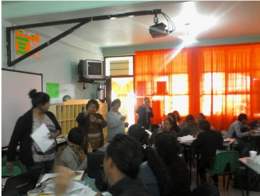
Fotografía N° 1.

Nota. Recuperado de Intervención en Consejo Técnico Escolar con taller de Lengua de Señas Mexicana. L. Bandera