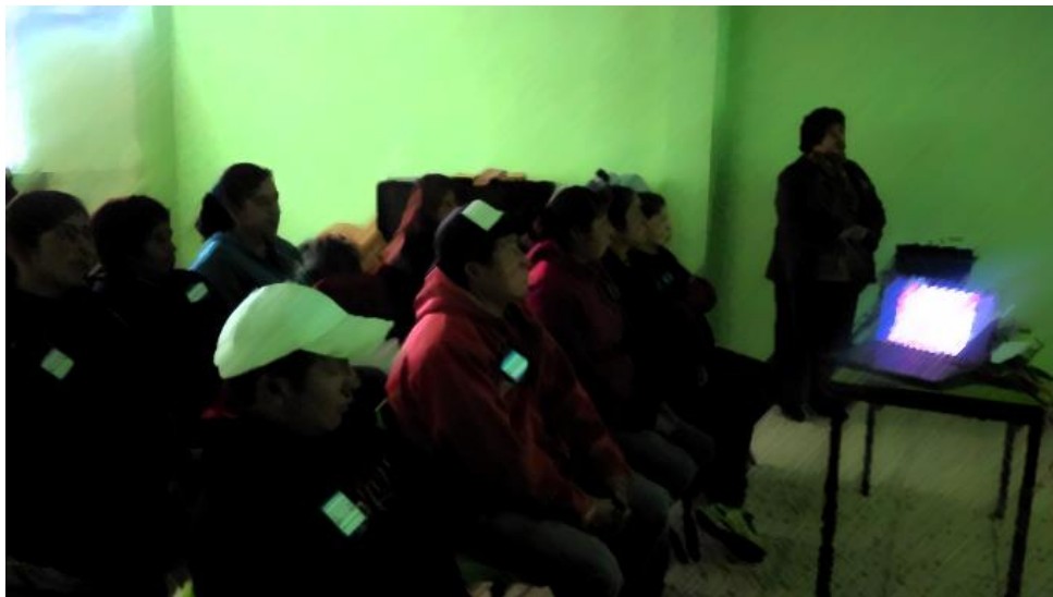
Fotografía N° 2

Nota. Recuperado de Intervención en Consejo Técnico Escolar con taller de Lengua de Señas Mexicana. L. Bandera