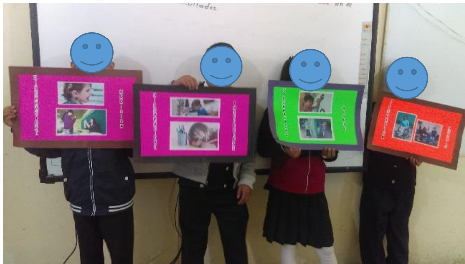
Fotografía N° 4

Nota. Recuperado de Proyección de videos a los alumnos y profesores como parte de la sensibilización e información. L. Bandera