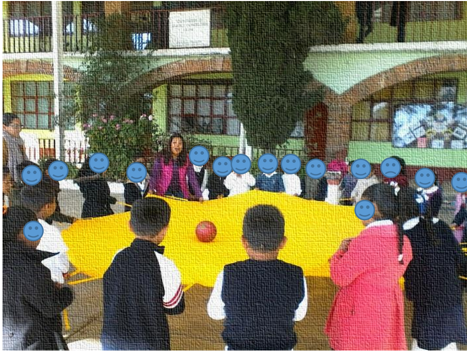
Fotografía N° 5

Nota. Recuperado de Información y sensibilización a los grupos de alumnos sordos incluidos. L. Bandera