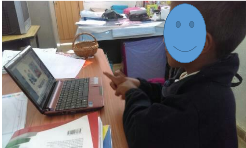
Fotografía N° 16

Nota. Recuperado de Trabajo con el tutorial “Dilo en señas”, para el manejo de señas convencionales. L. Bandera