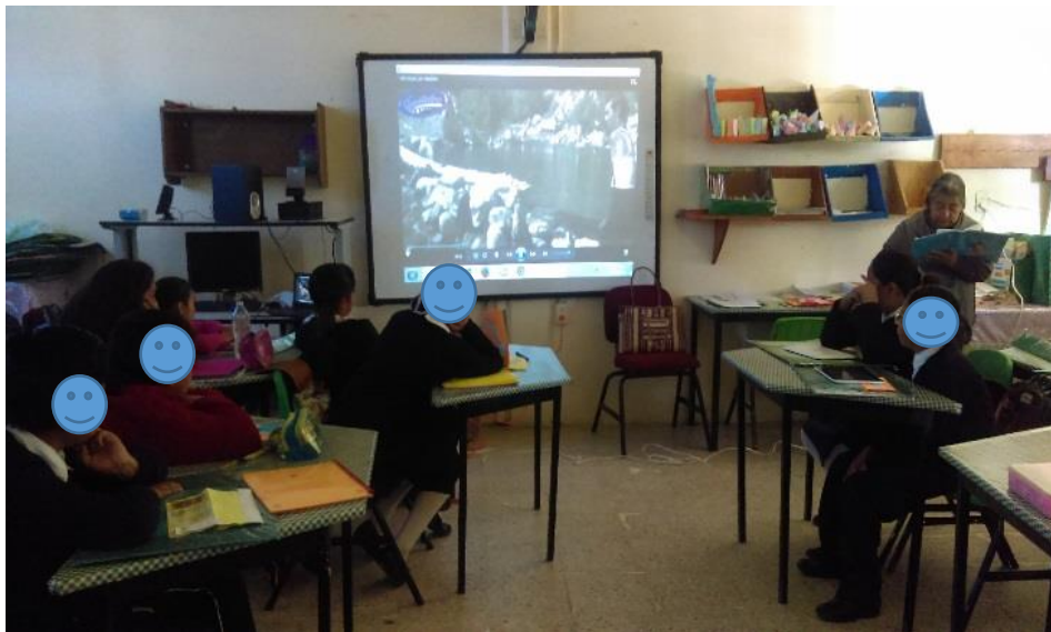
Fotografía N° 3

Nota. Recuperado de Proyección de videos a los alumnos y profesores como parte de la sensibilización e información. L. Bandera