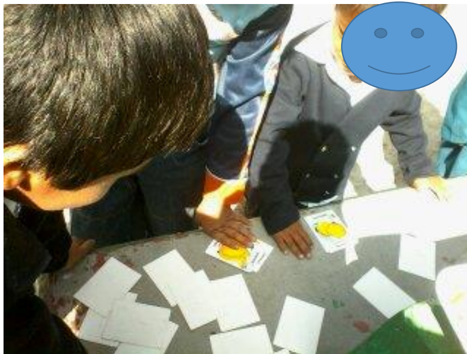
Fotografía N° 11

Nota. Recuperado de Sesión de acompañamiento con alumnos y padres de familia, para brindar apoyo y retroalimentación en casa.