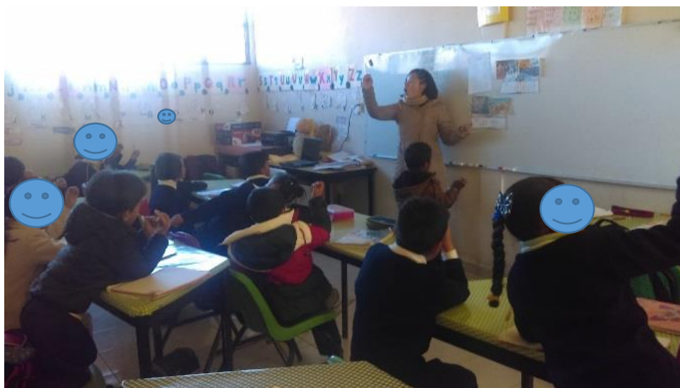
Fotografía N° 13

Nota. Recuperado de Acompañamiento en la aplicación de la evaluación bimestral. L. Bandera