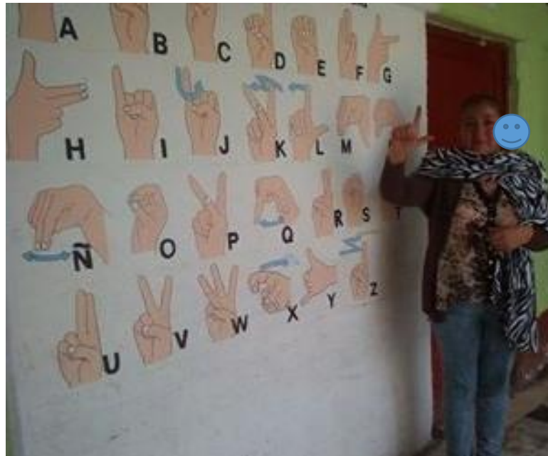
Fotografía N° 14

Nota. Recuperado de Intervención con vocabulario en Lengua de Señas Mexicana dentro del grupo regular de alumnos sordos incluidos. L. Bandera