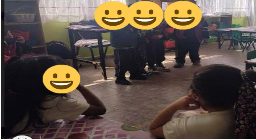
Figura 3. Representación de historias sobre los dinosaurios.

Aprendizaje Esperado que se logró: Representa historias y personajes reales o imaginarios con mímica, marionetas, en el juego simbólico, en dramatizaciones y con recursos de las artes visuales.