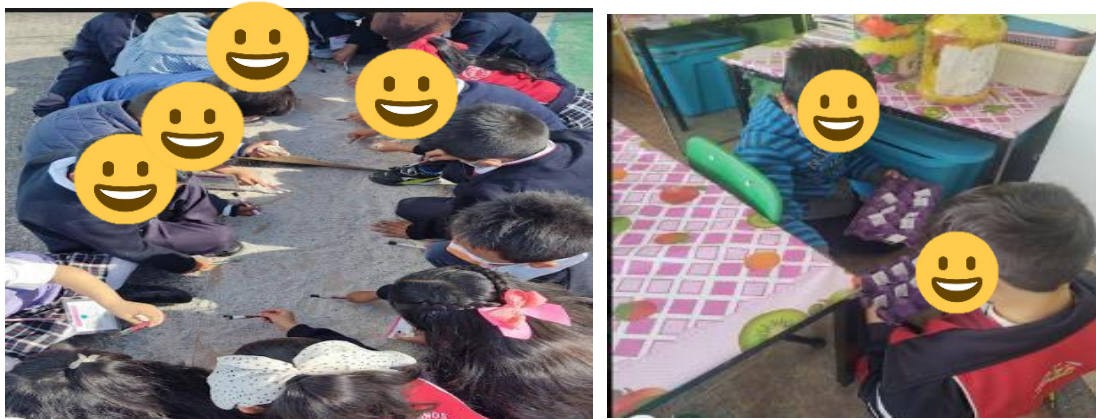
Figura 4. Elaboración y búsqueda de huesos de dinosaurio mediante el juego simbólico de paleontólogos y juego de adivina quién en parejas.