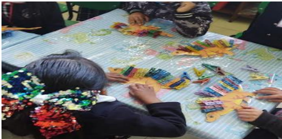
Figura 2. Resolución de problemas a través del conteo de púas de dinosaurios.

Fuente: Archivo personal de Brenda Ana González Filguera 7/11/2022