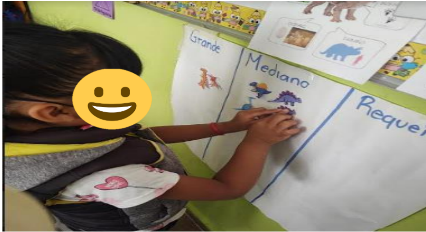
Figura 1. Clasificación por tamaño de dinosaurios.

Aprendizaje Esperado que se logró: Compara, iguala y clasifica colecciones con base en la cantidad de elementos.