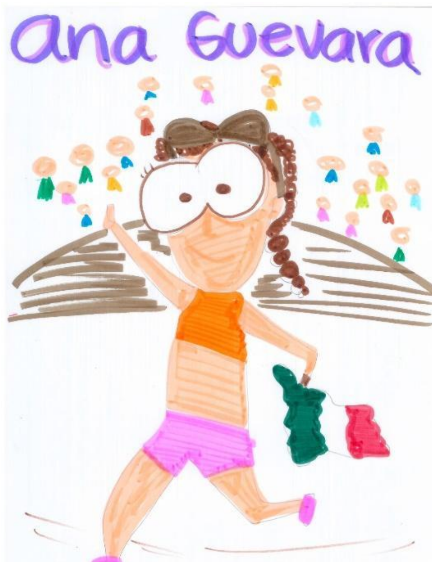
Figura 4. Ana Gabriela Guevara.

La grandiosa Ana Gabriela Guevara, quien con su desempeño deportivo impulsa a las niñas y mujeres a ser partícipes en los deportes, en las políticas de desarrollo deportivo y trabajar lo suficiente para vivir unos segundos increíbles en las pistas de atletismo, ha enseñado que la perseverancia tiene frutos y nos pueden hacer conseguir medallas olímpicas como su homóloga Soraya Jiménez.