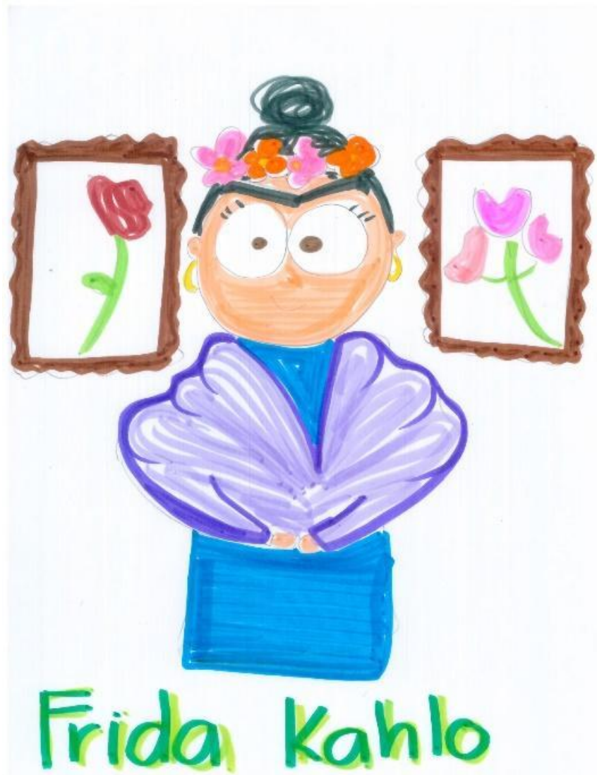
Figura 7. Frida Kahlo.

Finalmente se incluye a Frida Kahlo, artista que es conocida como una feminista de pies a cabeza que expresó y vendió su historia de vida a través del arte; expresó el dolor de vivir postrada por causa de un accidente en tranvía y el dolor de ser traicionada por el gran amor de su vida, muchas de sus pinturas fueron autorretratos que aún son comercializados y otros tantos elementos invaluable de exposiciones exitosas por todo el mundo.