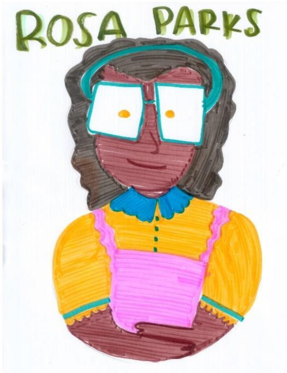
Figura 3. Rosa Parks

Se encuentra en las tarjetas a Rosa Parks por haber sido una mujer que reclamó abiertamente sus derechos para hacer uso del transporte público pese al color de su piel y ser mujer.