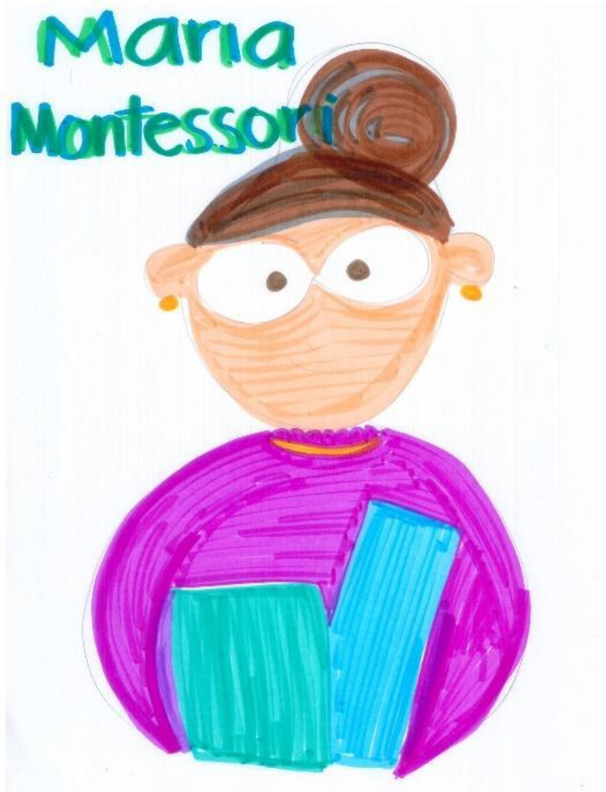
Figura 1. Maria Montessori.

Por tanto, se ha elegido a Maria Montessori por sus grandes aportaciones a la educación en la que hace que la experiencia educativa sea vivida, en contextos reales y pertinentes a la realidad social en donde el alumno es el protagonista y por tanto los ambientes deben ser adaptados a ellos y no al revés.