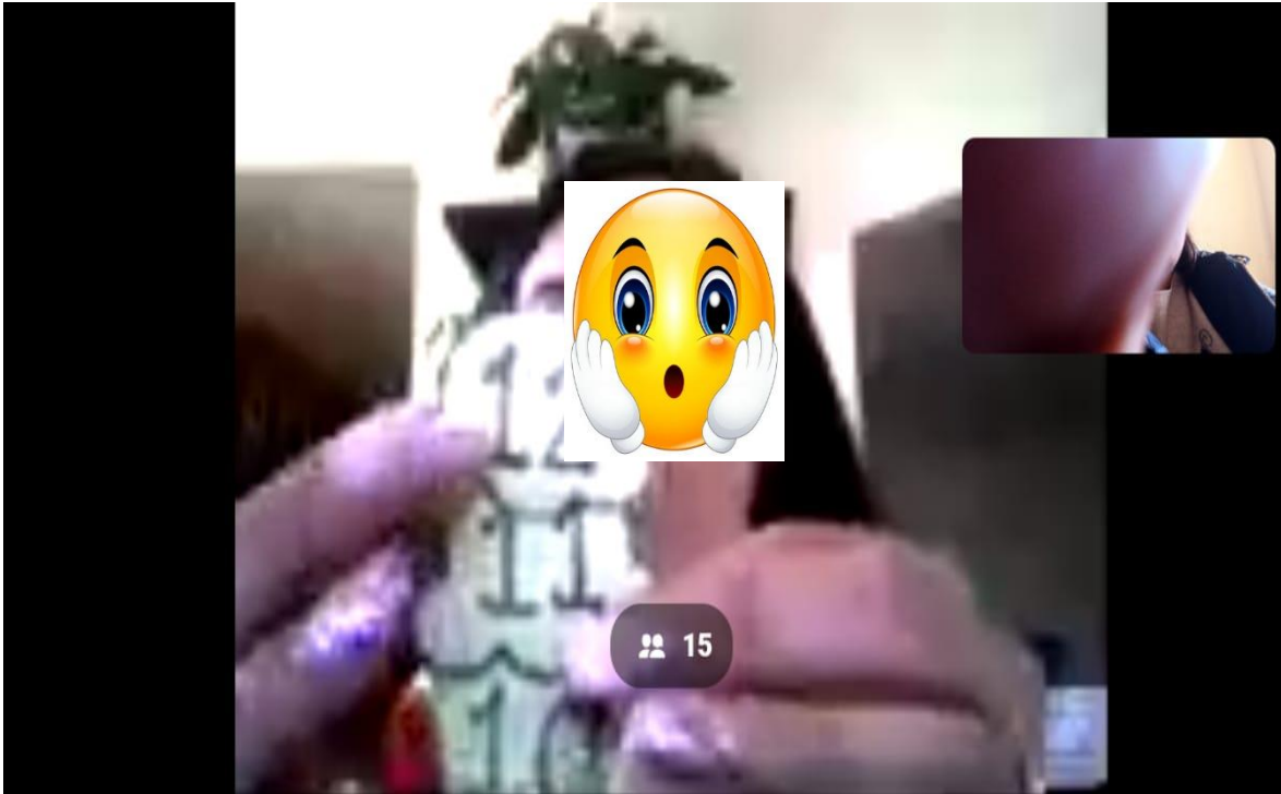
Nervis L, 2021, clase virtual “helado de números”, fotografía.