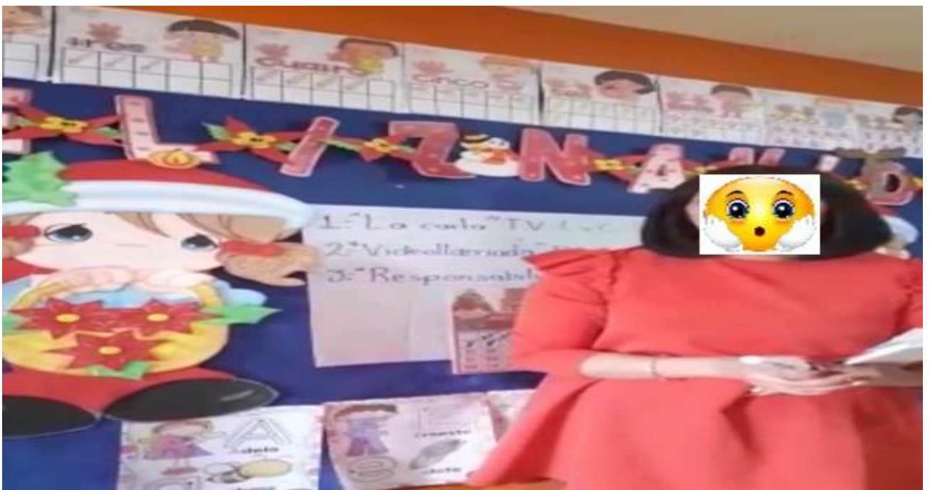
Nervis L, 2021, Grabación y explicación de la secuencia de actividades del día; fotografía.