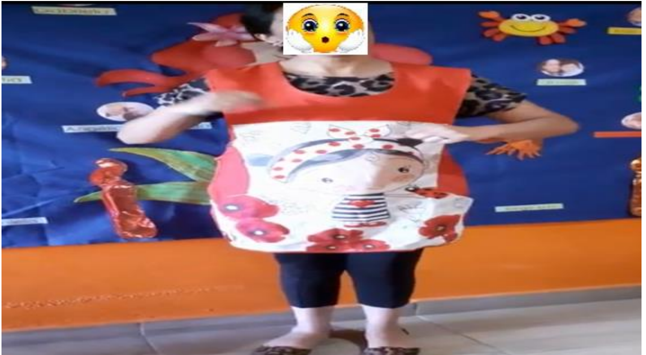
Nervis L, 2021, Grabación de canciones didácticas, fotografía.