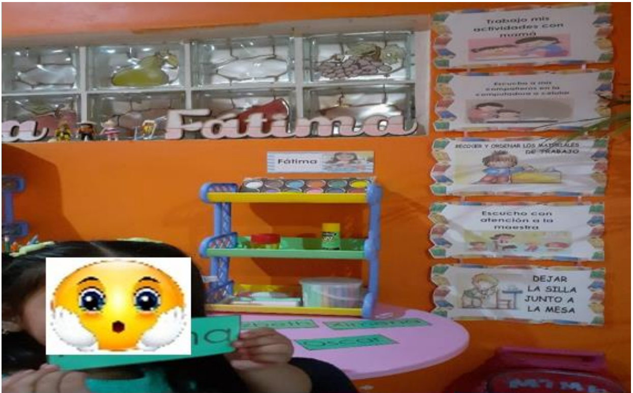
Nervis L, 2021, Adaptación de espacios de trabajo en casa de una alumna, fotografía