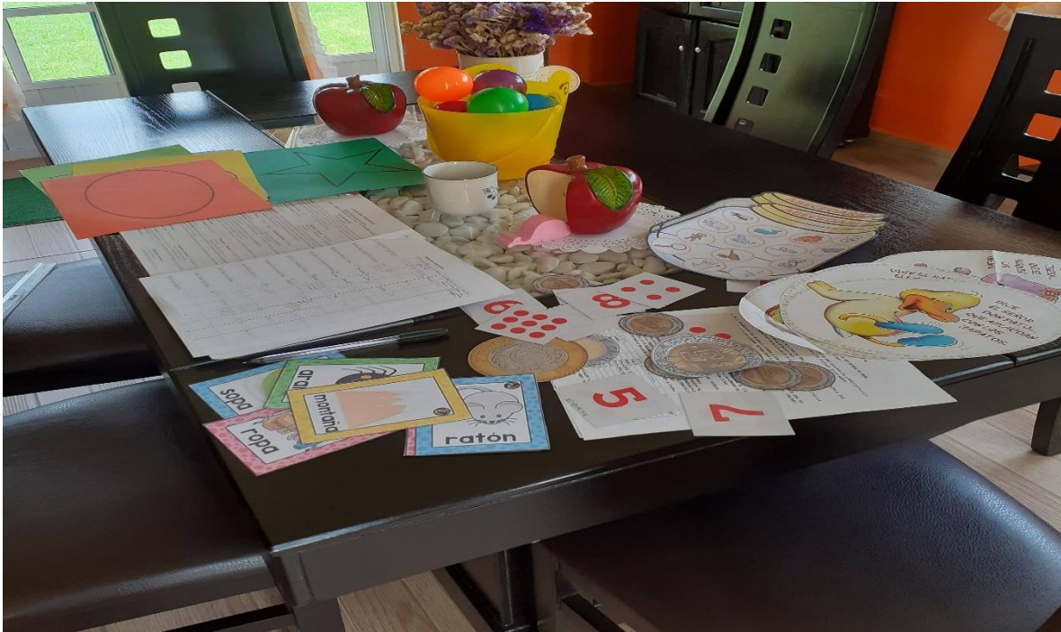
Nervis L, 2021, Materiales de apoyo para la evaluación y seguimiento del primer momento en línea de forma personal.