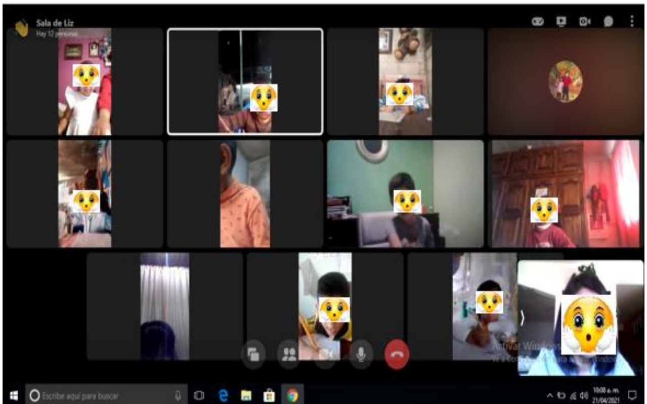
Nervis L, 2021, Clases virtuales “Actos de escritura”