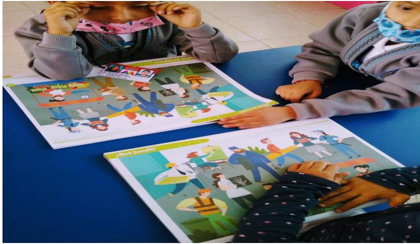
Elaborando la lámina del libro mi Álbum “ Qué hacen”