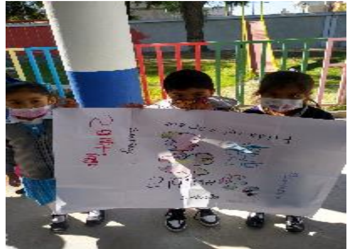
Compartiendo cómo es su localidad