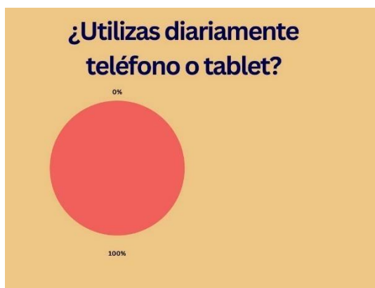
Imagen 2: representa de forma gráfica la respuesta a la pregunta ¿utilizas diariamente el teléfono o Tablet?

Otra de las preguntas que se les plantearon a los alumnos fue ¿utilizas diariamente el teléfono o la Tablet