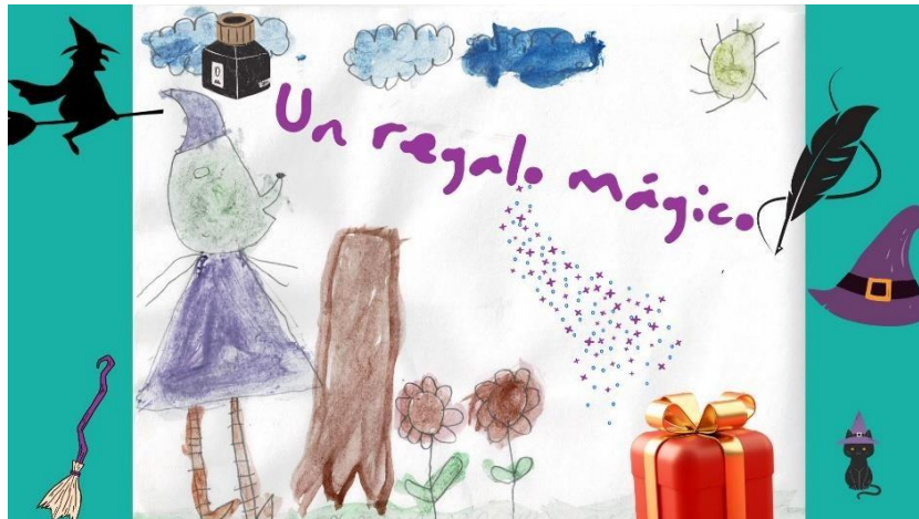
Imagen 5: Portada del cuento “Un regalo mágico”

de hacer más interesante el cuento, esto porque se debe a que es indispensable hacer “posible que los alumnos vivan experiencias en las que se asuman como sujetos activos capaces de encontrar soluciones y explicaciones.” (SEP, 2017, p.161).