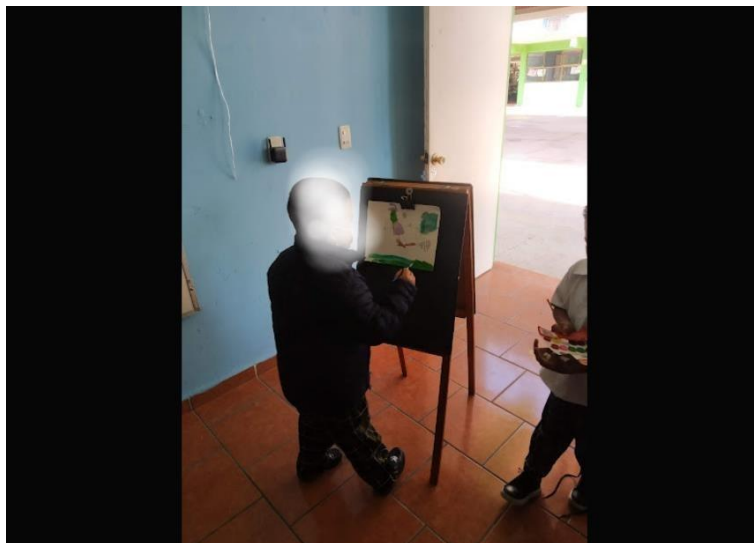
Imagen 5: se muestra un alumno realizando su representación de una escena del cuento “Un regalo mágico”.

Una vez observados los vídeos cada alumno formulo ideas para poder construir un cuento para después dar a conocer la información a más personas, en este caso los alumnos propusieron mostrar el cuento a los compañeros de la escuela y es en este proceso donde nace el material didáctico del vídeo cuento llamado “Un regalo mágico”.