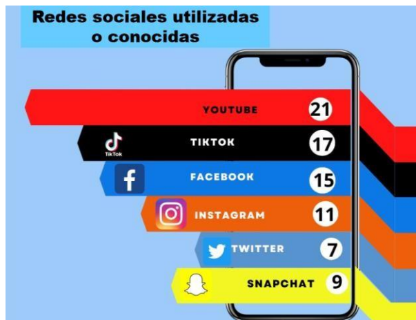
Imagen 4: representa de forma gráfica la respuesta a la pregunta ¿Cuáles de estas redes sociales utilizas o conoces?

La última pregunta planteada a los alumnos fue ¿Cuáles de estas redes sociales utilizas o conoces?