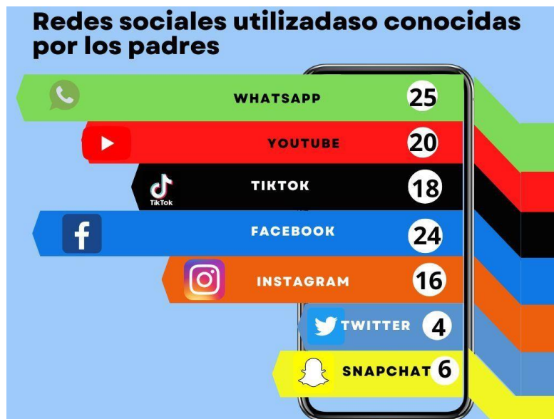
Imagen 6: respuestas de los padres sobre el conocimiento y uso de las redes sociales.

Se mostraron los vídeos seleccionados por los niños tratando de que reflexionen sobre el uso de los dispositivos móviles y se les oriento con algunas actividades con las que pueden apoyar a sus hijos para fortalecer el desarrollo psicomotor fino y grueso, así como fomentar ambientes donde las niñas y niños los vean leer y escribir.