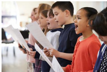
Ilustración 1. Niños cantando

Para el futuro, para el futuro hay que cuidar, hay que cuidar, este mundo bello, este mundo bello. Hay que tirar, hay que tirar, la basura, la basura en su lugar, en su lugar.