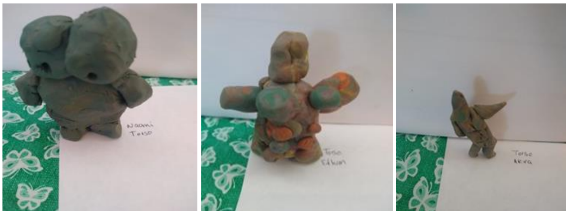
Anexo 3. Imagen de autoría propia. Marlem Moreno Cuevas. Escultura de torso.