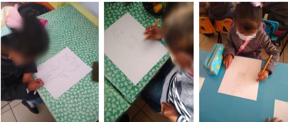
Anexo 6. Imagen de autoría propia. Marlem Moreno Cuevas. Dibujo de el monstruo de mis sueños.