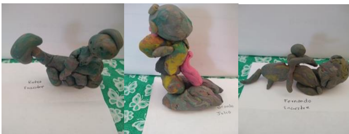
Anexo 5. Imitan escultura orante y encuestre.