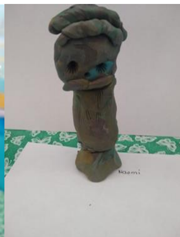
Anexo 2. Imagen de autoría propia. Marlem Moreno Cuevas. Esculturas de busto.