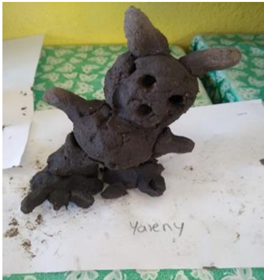
Anexo 8. Imagen de autoría propia. Marlem Moreno Cuevas. Escultura de el monstruo de mis sueños.