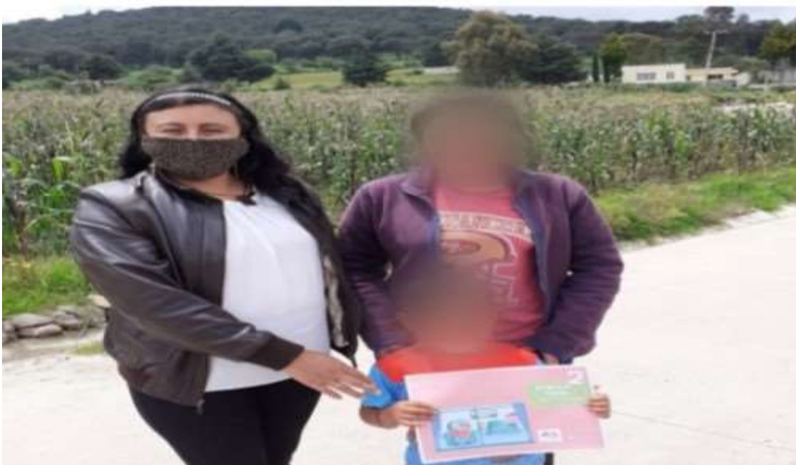
Fotografía 9. Visitas domiciliarias

Nota. Visitas para situación de aprendizaje, trabajo con material educativo, valoración de logros y áreas de oportunidad a partir de la autoevaluación y la entrevista. Autoría propia.