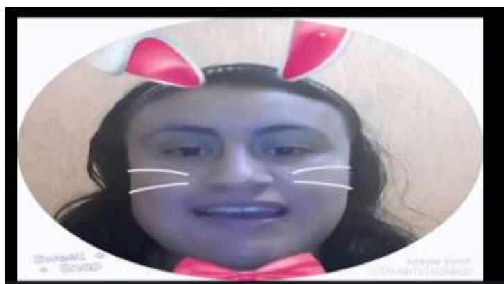
Fotografía 2. Lecturas en video

Nota. Video con edición de imágenes y efectos de sonido en aplicaciones digitales para favorecer en los alumnos habilidades de lectura y escritura y captar su interés. Autoría propia.