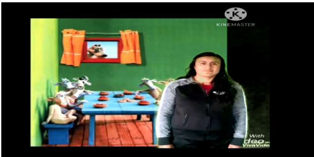
Fotografía 1. Lecturas de texto en voz alta en video

Nota. Lectura con texto y edición de imágenes para hacer significativo el aprendizaje y favorecer oralidad y escritura en los alumnos. Adaptado de Los siete cabritillos y el lobo, por Vilagut, s/f, Everest.