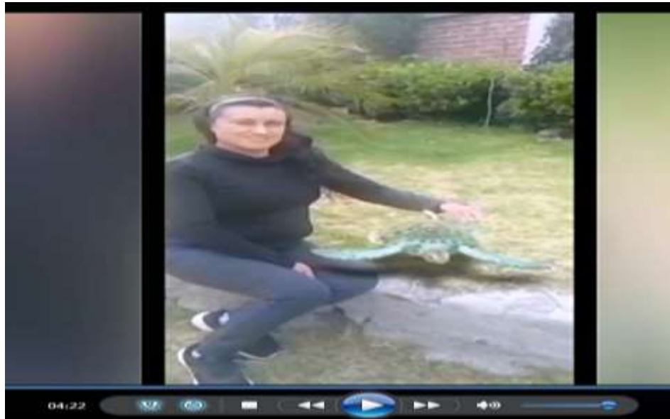
Fotografía 3. Edición de videos con temas del medio natural

Nota. Videos para contribuir al aprendizaje de características comunes que identifican entre seres vivos y elementos que observan en la naturaleza. Autoría propia.