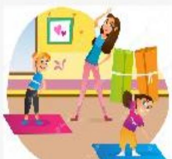
Imagen 7