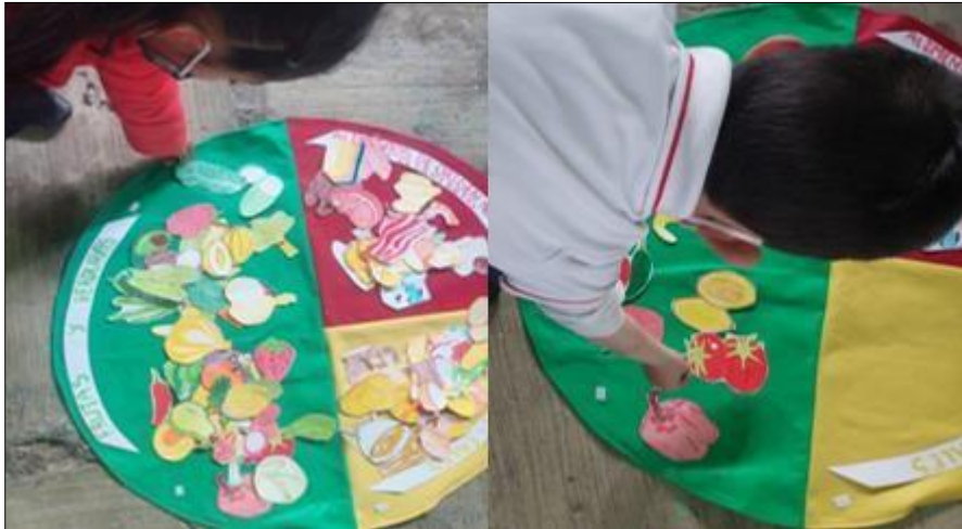
Imagen del autor