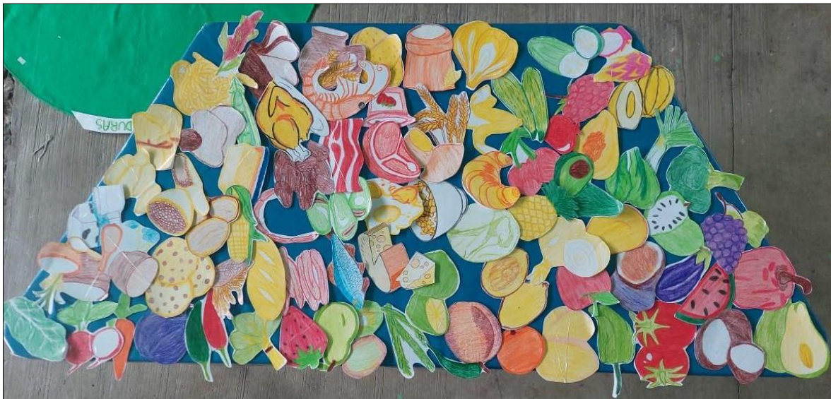
Imagen del autor