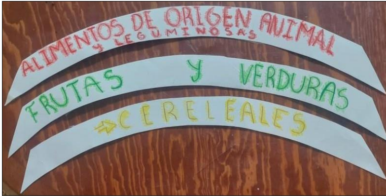
Imagen del autor