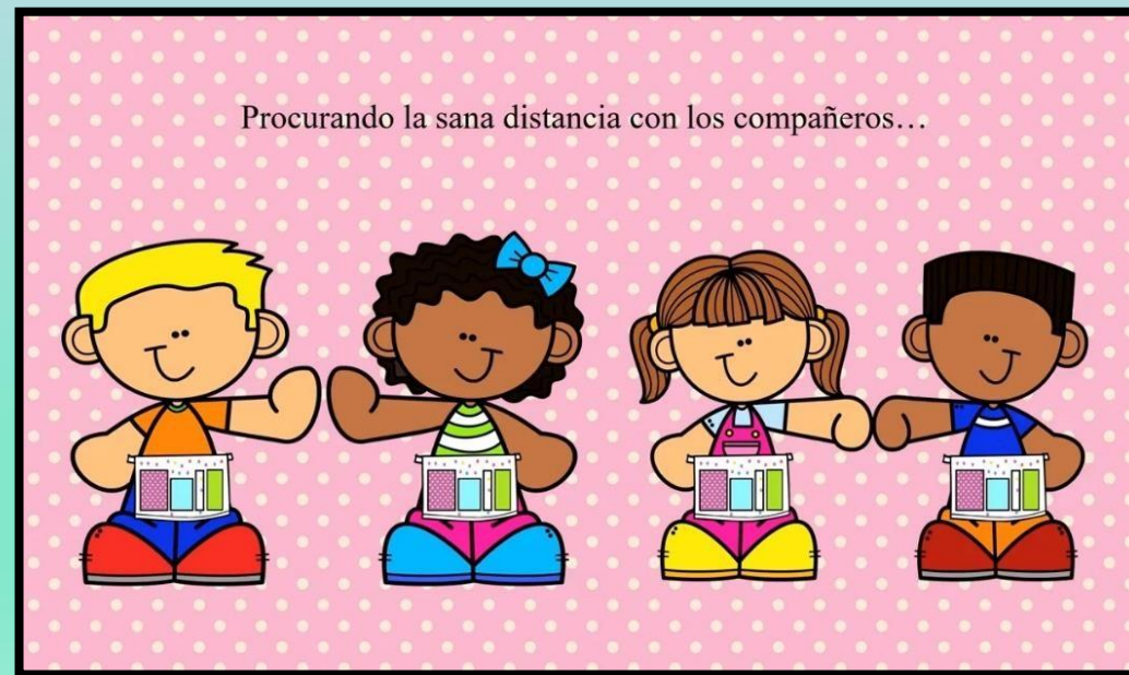
Ilustración 4 Krista Wallden - Creative Clips