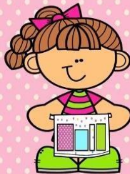
Ilustración 8 Krista Wallden - Creative Clips

Existen estudios, previamente mencionados en este documento, mencionando que es sugerible no enjuagar los restos de pasta o crema dental, sin embargo, por el sabor y consistencia de la misma, puede efectuarse el enjuague para hacer que la experiencia de los alumnos sea menos astringente.