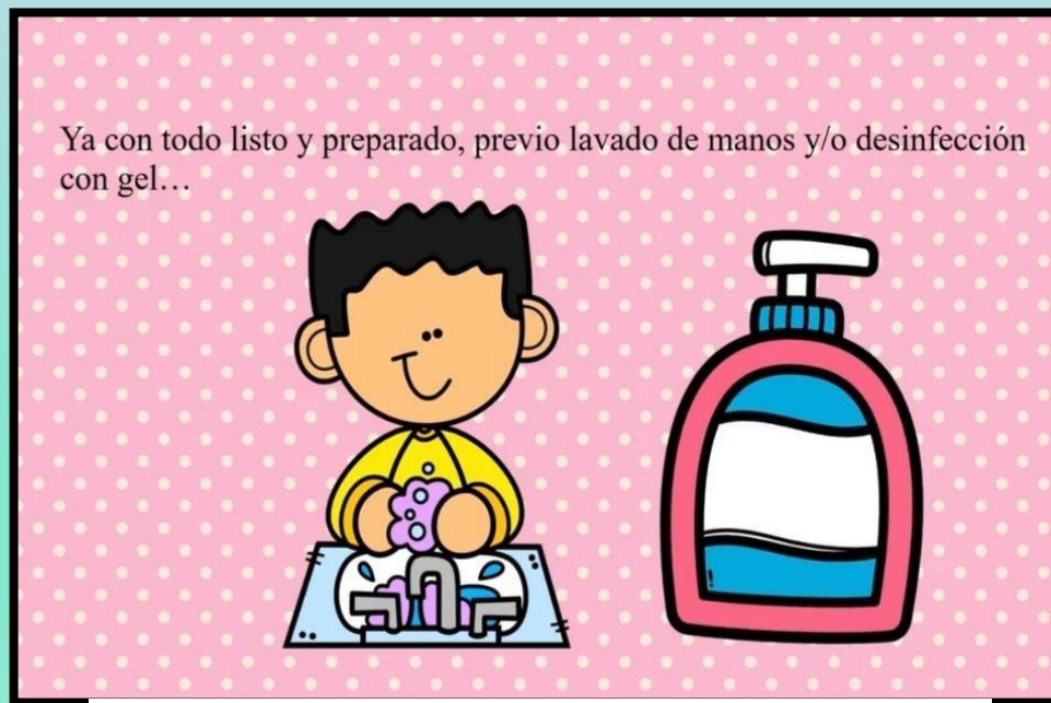
Ilustración 5 Krista Wallden - Creative Clips

2.- Una vez identificada la zona para realizar la práctica, el docente o promotor deberá iniciar con la sanitización de manos antes de iniciar la técnica de cepillado, se sugiere utilizar alcohol en gel al menos al 60% o bien algún otro sanitizante recomendado para manos.