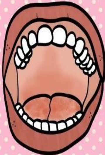
Ilustración 7Krista Wallden - Creative Clips

7.- Es importante realizar posteriormente el cepillado de la lengua, el cual se puede efectuar en forma de barrido, utilizando el cepillo dental o bien el limpiador de lengua, partiendo desde la base o parte posterior (atrás) con movimientos hacia adelante en repetidas ocasiones, para finalmente terminar el cepillado y enjuagar con agua natural a fin de remover los restos de pasta o crema dental, utilizada.