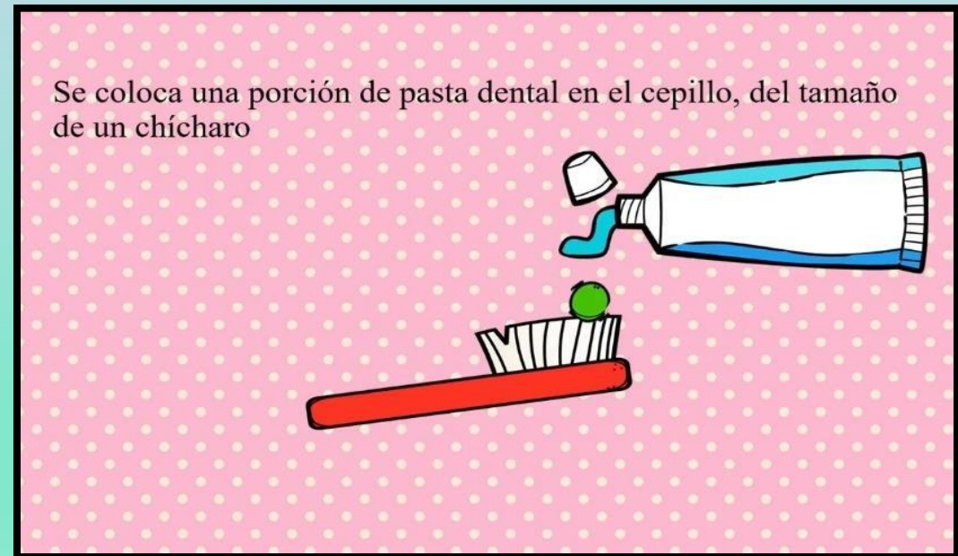
Ilustración 6 Krista Wallden - Creative Clips