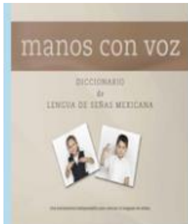
Libro mis manos que hablan

Los invito a explorar los siguientes libros, que son los que se están utilizando a nivel país. Estos nos ayudarán a conocer un poco más sobre las generalidades de la Lengua de Señas y aprender vocabulario de forma visual. Asimismo, les dejo algunas aplicaciones que pueden utilizar para aprender más sobre esta lengua, nos permiten aprenderlo de forma interactiva y poder interesarnos más para poder comunicarnos con las personas sordas y poder eliminar las barreras de comunicación.