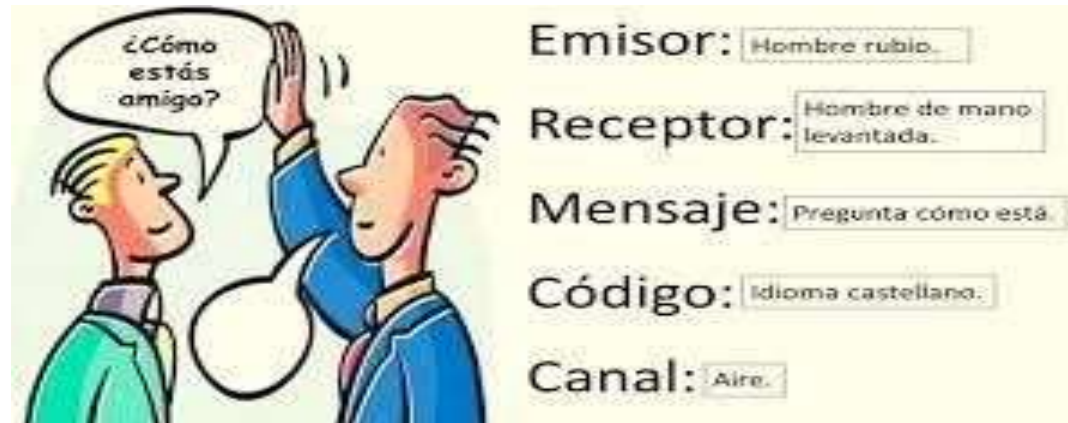
3 Ejemplo de Figura comunicación

https://www.youtube.com/watch?v=xF8lqF9LMAg