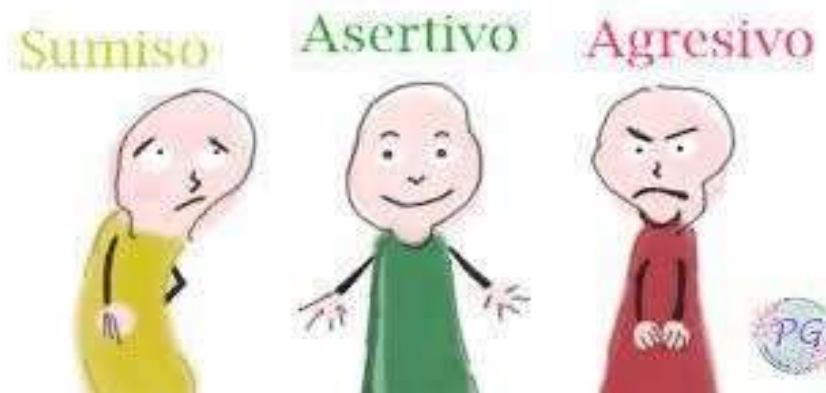
Figura 4 Tipos de comunicación

Las personas que dominan este estilo de comunicación saben cómo defenderse en cualquier situación que se presente. Son el tipo de comunicadores que saben cómo expresar sus opiniones y defender lo que quieren. Los comunicadores asertivos pueden usar gestos son expresivos a la hora de aportar su opinión, con las manos hacen movimientos mientras se comunican de manera no verbal, y es probable que tengan expresiones faciales relajadas o que muestran felicidad al hablar.