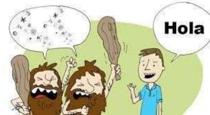
Figura 1 Necesidades de comunicarnos

La comunicación para el desarrollo es por lo tanto de gran utilidad para poder generar reflexión y toma de conciencia sobre las distintas temáticas que afectan al desarrollo humano sostenible como la igualdad entre géneros, la exclusión, la inmigración, la sostenibilidad o la ciudadanía global.