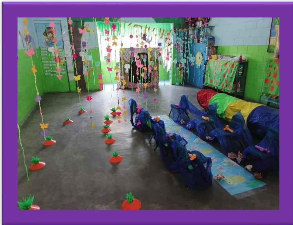
Autoría propia. María Macedo González. Octubre 2022. Estrategia de cuento motor

Al final se cuestiona a los alumnos acerca de la experiencia vivida, expresaran que parte les agrado más del cuento, si les dio miedo el oso, que piensan de cazar a los animales, permitiéndoles expresar sus ideas, conocimientos y sentimientos complementando la actividad con un dibujo de lo que más les agrado.