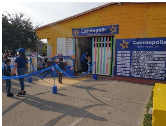
Autoría propia. María Macedo González. Octubre 2022

Con base en lo mencionado anteriormente en la institución diseñamos, organizamos e implementaremos la estrategia de “Cuentópolis” con la finalidad de que los alumnos accedan a los aprendizajes, permanezcan y logren avanzar de la mejor forma en los mismos.