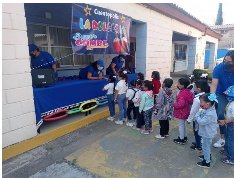
Autoría propia. María Macedo González. Octubre 2022. Los niños se encuentran formados para recibir su combo depalomitas y agua para disfrutar el cuento