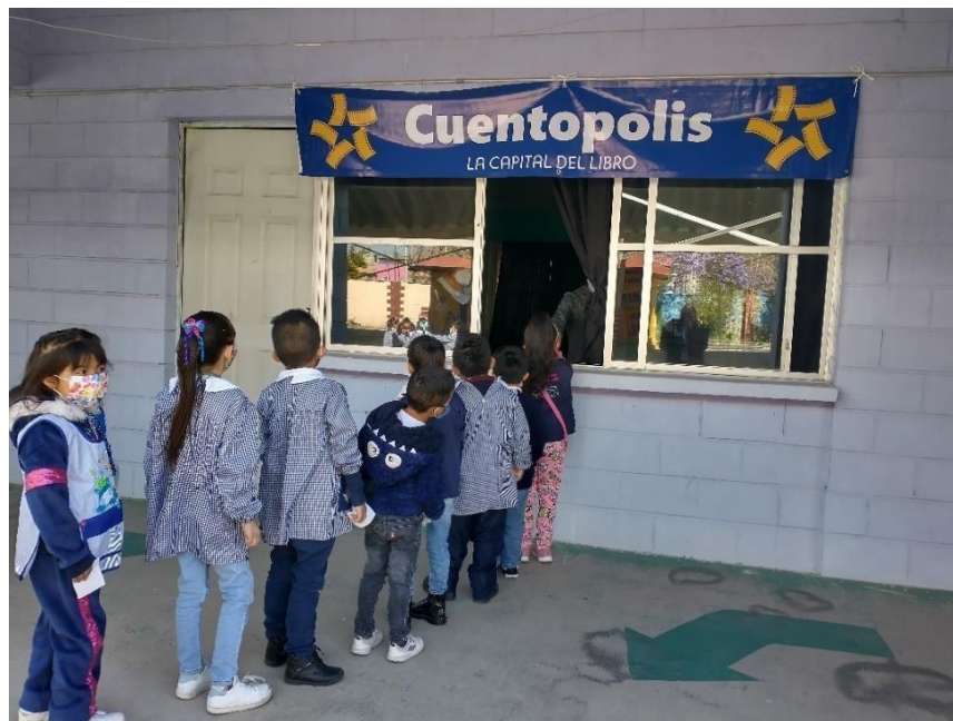
Autoría propia. María Macedo González. Octubre 2022. Los niños se encuentran formados para elegir a que sala desean asistir

Es recomendable que los alumnos tengan dominio sobre el conteo en lo que respecta a los rangos numéricos de los datos. Para comprender la relación de equivalencia entre monedas, es necesario el trabajo en el grupo con problemas de compra y venta en escenarios reales.