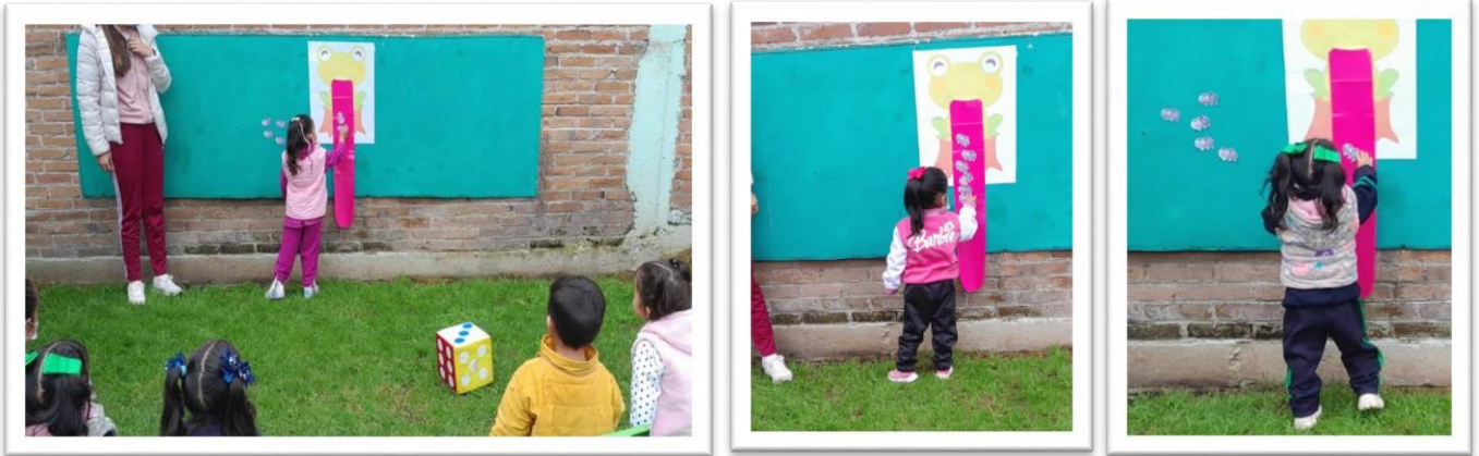
Momento en el que los alumnos registraron los puntos del dado con apoyo de imágenes.