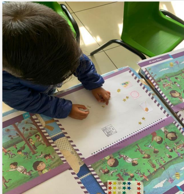
Registro de la cantidad de elementos observados en la imagen con apoyo de stickers

La presente actividad fue el cierre de la situación en la que se hizo uso del libro “Mi álbum” pag.26, en la que juntos observamos los elementos de la imagen dando respuesta a cuestionamientos como: cuántos niños están jugando al caballito de palo, cuántos tienen un aro, cuántas canicas observas, representando dichas cantidades con stickers de estrella en la página de registro.