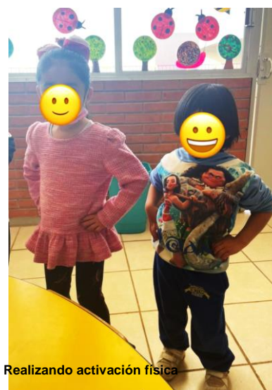
Realizando activación física

Desde el inicio del ciclo escolar fue importante realizar activación todos los días. Al inicio de la jornada de trabajo se les invitaba a mover su cuerpo al ritmo de la música variada.