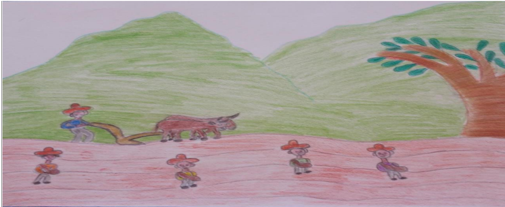
Fuente: Aurelia García Vargas. Ilustración Arando la tierra. 22 de enero del 2023.

Y su papá todas las mañanas antes de salir el sol, salía al campo a trabajar, a arar la tierra para el cultivo de maíz, frijol y calabaza, Juan y sus hermanos lo acompañaban. En los momentos de descanso el papá aprovechaba para enseñarles a leer y a escribir, también les contaba varias historias. Entre ellas “La paleta gigante”.