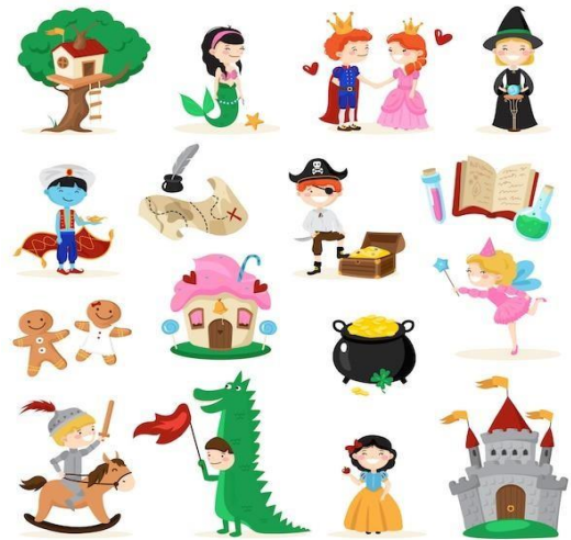
Ilustración tomada de la web: https://www.freepik.es/vectores/nino-con-libros/4

El educador planteará las preguntas pertinentes a la obra o imagen que se observará y describirá.