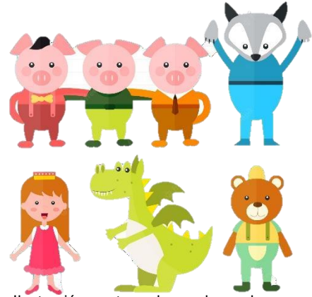
Ilustración tomada de la web https://www.freepik.es/vector-premium/ilustracion-personajes-cuentos-infantiles_848853.htm

Elegir el cuento clásico y se les comentara a los alumnos que jugaremos con la historia un poco mientras se lee.