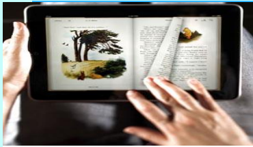
Título desconocido (2012)