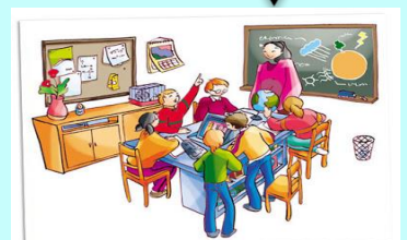
Título desconocido (2011), [Imagen] de Autor desconocido. Recuperada de: https://bradanovic.blogspot.com/2011/07/quiere-dinero.html CC BY-SA

Junto a los menús, es necesario saber interpretar los iconos y los elementos multimodales utilizados en internet, como las imágenes, los hipervínculos, los vídeos, etcétera. Por todo ello es fundamental que antes de consultar una web, los niños establezcan sus objetivos de lectura y lo sigan mientras navegan en internet.