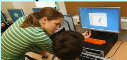
Título desconocido (2016), [Fotografía] de Autor desconocido. Recuperada de: https://www.eoi.es/blogs/gestioneducativa/2016/05/24/talento-y-tecnologia-en-la-escuela-q/ CC BY-SA-NC

En pantalla los textos no son estáticos; la lectura es hipertextual, híbrida y multimodal; y la información no es lineal ni cronológica. Por estos motivos para leer en pantalla son necesarias unas habilidades específicas, además de las destrezas habituales, la búsqueda de información, la inferencia de los significados no explícitos y la reflexión sobre la forma y contenido de los textos.