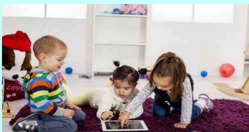
Martes en aprender (2014), [Fotografía] de Autor desconocido. Recuperado de: https://bibliotecascolaresargentinas.wordpress.com/2014/12/06/leer-en-la-era-digital-que-cambia-para-las-nuevas-generaciones-facebook/ CC BY-SA-NC

Hoy es un reto para los alumnos en la sociedad integrarse, convivir, desarrollar un espíritu crítico, aprender, etc. Han de poder comprender textos diferentes, en ello los docentes tienen la posibilidad de crear el germen que ayude a los alumnos a leer con sentido y, por tanto, a adquirir esta competencia clave para su presente y futuro.