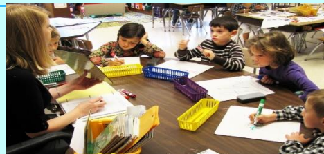
Actividades para enseñar a leer y escribir niños (2012), [Fotografía] de Autor desconocido. Recuperado de: https://buscaremplo.republica.com/formacion/actividades-para-ensenar-a-leer-y-escribir-ninos.html CC BY-SA-NC

Internet ha acentuado la importancia y la complejidad del acto de leer, pues se deben desarrollar otras habilidades además de las de siempre en los estudiantes.