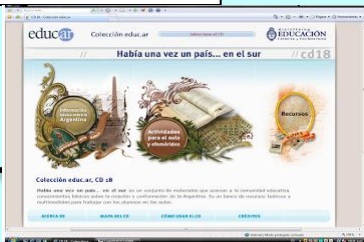
Título desconocido (2008), [Imagen] de Autor desconocido. Recuperada de: http://hayalguien-ahi.blogspot.com/2008/02/materiales-educativosaguzando-la-mirada.html CC BY-SA

Enseñar a leer y a comprender es enseñar a pensar, a aprender, a comunicarnos. Leemos para satisfacer distintas necesidades sociales y también para lograr objetivos personales. En la actualidad la lectura no puede entenderse al margen de los nuevos formatos digitales.