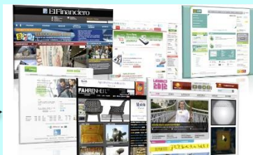
Páginas web diseñadas por NA-AT Technologies (2012), [Imagen] de Carlosechnaat. Recuperado de: https://es.wikipedia.org/wiki/Archivo:Webs.png CC BY-SA

Como los menús son grandes organizadores de las webs, conviene ayudar a los alumnos a observarlos para acceder al contenido que guardan. Y, sobre todo, concienciarlos sobre la importancia de reflexionar, para ser más eficaces en la búsqueda de la información.