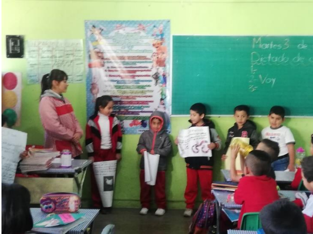
Escultura de la Fauna de mi comunidad