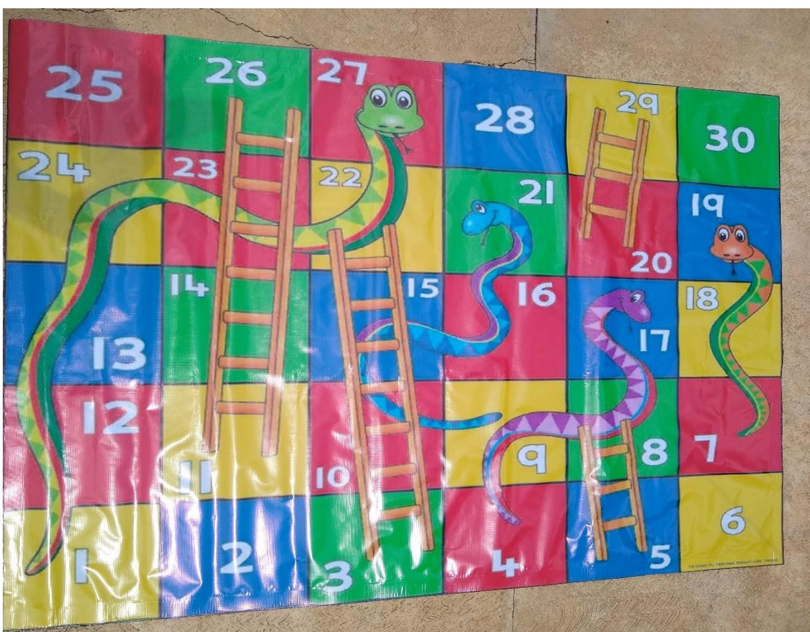
Anexo 11. Foto de evidencia del material didáctico innovador empleado en la situación didáctica “Serpientes y escaleras”.