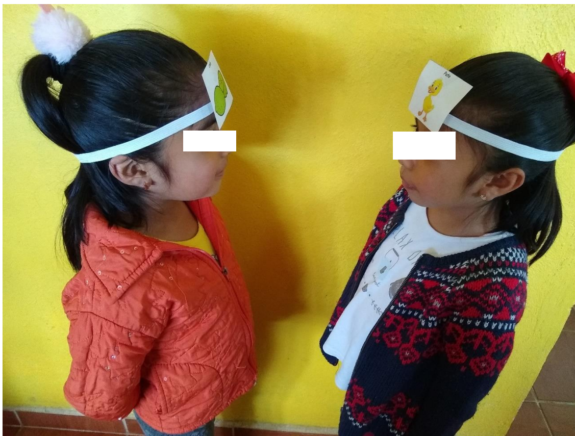
Anexo 16. Foto de evidencia del material didáctico innovador empleado en la situación didáctica “Adivina qué o quién es”.