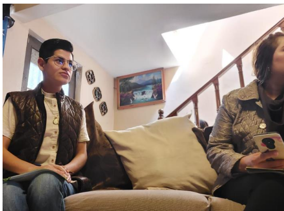
Ilustración 7 Gestión educativa en la entrevista.