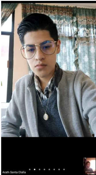
Ilustración 2 Primera intervención de práctica.