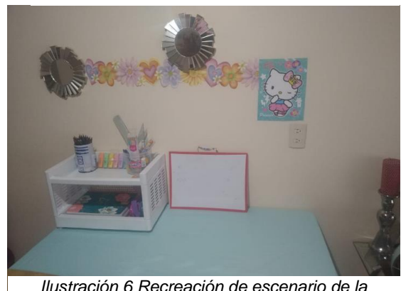
Ilustración 6 Recreación de escenario de la docente.