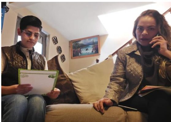
Ilustración 4 Participación de la entrevista.