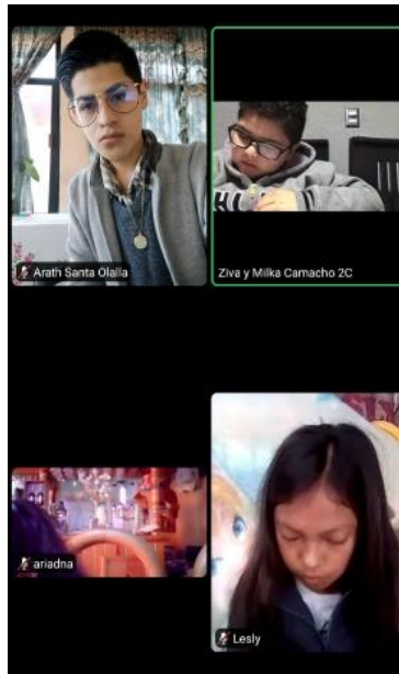
Ilustración 3 Participación de la práctica en Matemáticas.