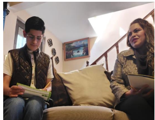
Ilustración 5 Gestión educativa en la acción docente.