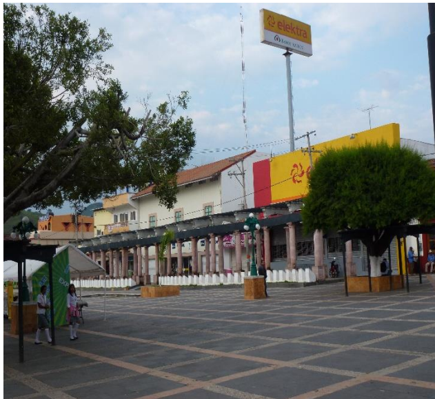
Algunas de las tiendas de Tejupilco

Con respecto al ámbito económico, en la colonia de Centro de Tejupilco la mayoría de la población se mantiene ocupada en sus labores de trabajo, algunas personas que se esfuerzan por mantener sus negocios propios, viéndolo desde esta perspectiva existen personas que por sus esfuerzos y dedicación han logrado obtener una profesión, de las cuales destacan la de maestro (a), licenciados, contadores entre otras, algunos otros solo han logrado obtener un oficio como son: albañil, plomeros, carpinteros etc.