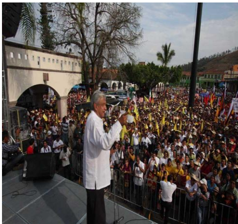
Visita de los políticos a la ciudad de Tejupilco

Se realizan reuniones para dar a conocer las propuestas de los diversos personajes políticos que prometen a los pobladores el cielo y las estrellas, en estos mítines se hace entrega a los pobladores obsequios por parte de los candidatos que al final de cuentas olvidan y terminan por ignorar las necesidades prioritarias de la delegación