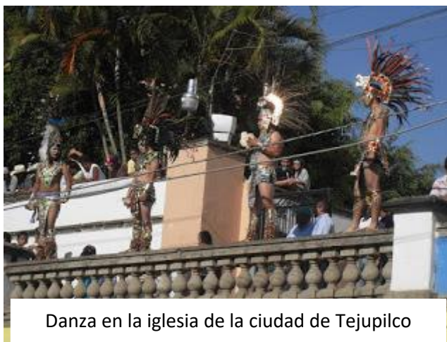
Danza en la iglesia de la ciudad de Tejupilco

Esta colonia cuenta con su propia iglesia en ella la mayoría de los habitantes asisten a misa todos los domingos a la parroquia de San Pedro Apostol a las 6:00 am, 10:00 am, 12:00 pm y 6:30 pm. Dentro de sus fiestas patronales estos habitantes adoran a San pedro,