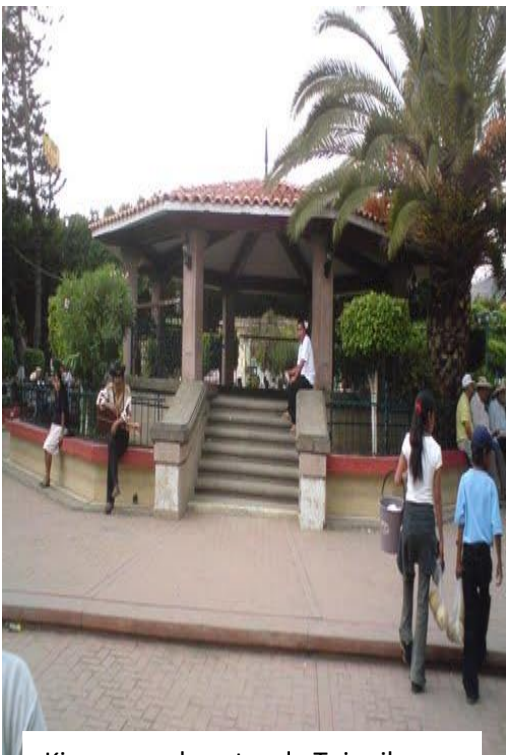
Kiosco en el centro de Tejupilco

A grandes rasgos, al hablar sobre este aspecto nos conlleva a recalcar las condiciones de vida, servicios de salud, programas sociales, convivencia social, manifestaciones de violencia e inseguridad de la colonia.