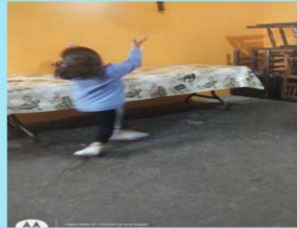
Alumna de la Escuela Primaria Emiliano Zapata, Zona Escolar P159, dónde utiliza un globo y lo golpea con diferentes segmentos corporales.