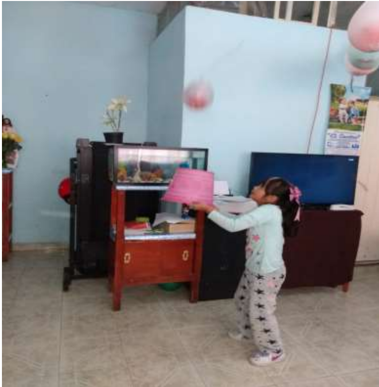
La alumna muestra la habilidad adquirida al golpear con la cubeta, manteniendo el globo en el aire, evitando que caiga al piso.