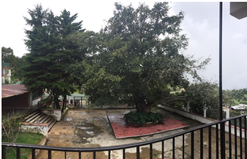
Imagen No.4 Centro de Educación para la Atención de Jóvenes y Adultos “Nicolás Bravo”

En la actualidad el edificio es prestado por las autoridades municipales para albergar las supervisiones escolares bajo la responsabilidad de cada una de ellas, entre las que se encuentra la Supervisión de la Zona Escolar A035 de EJA, así como también el CEAJA “Nicolás Bravo”. En el centro de la arquitectura del edificio se encuentra uno de los pocos árboles de Amate, del cual se deriva el nombre del municipio, siempre verde, de 24 metros de altura y 2 metros de diámetro, generoso con su sombra, su fruto es una esfera carnosa parecida al higo. (Ver Imagen No.4).