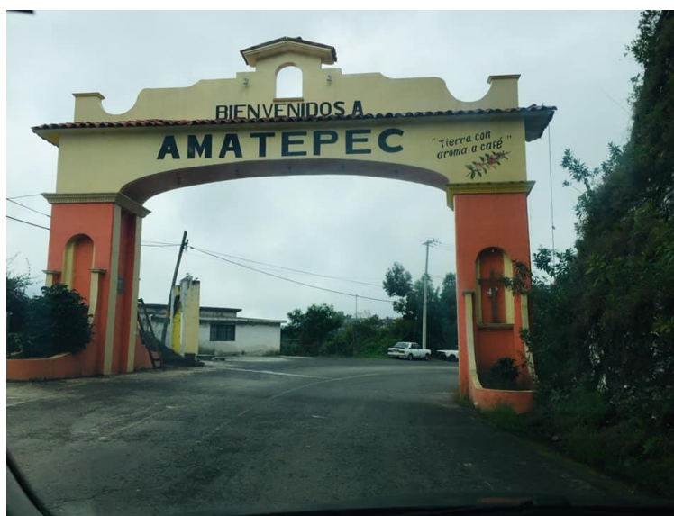
Imagen No.3 Arco de entrada a la cabecera municipal de Amatepec

Al llegar a la cabecera municipal donde se encuentra el CEAJA, escenario de la investigación, el clima se torna frío, húmedo, característico del lugar por su altura sobre el nivel del mar, en verano en época de lluvias las calles se cubren de neblina, y es frecuente el aroma a café, debido a que es un lugar donde se cultiva la planta y es común que la mayoría de la gente tueste café. (Ver Imagen No.3).