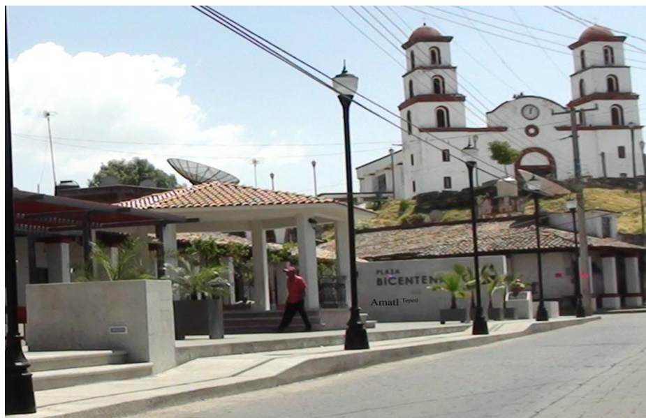
Imagen No. 2 Cabecera municipal de Amatepec