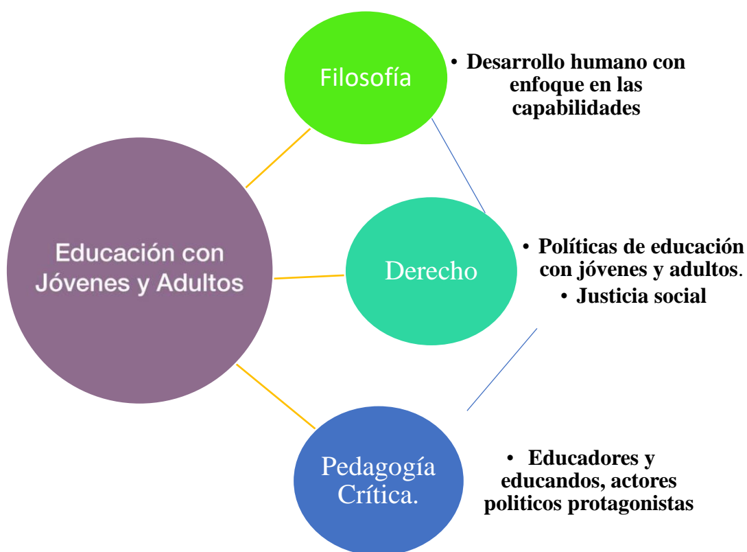
Esquema No.1 Articulación de disciplinas

opresoras, (Freire, 1976) y centrándose en la capacidad que tienen los actores educativos de ser protagonistas, esto es, de poder decidir y no ser sujetos pasivos. De la Filosofía como la posibilidad de integrar la perspectiva del desarrollo humano con enfoque en las capacidades (Sen, 2000) que tiene dos elementos, la evaluación del ser y hacer (de los funcionamientos) y la libertad, siendo ésta la elección genuina entre funcionamientos, lo que conocemos como la buena vida y no la idea de que una persona este forzada a vivir una vida en particular (Ver Esquema No.1).