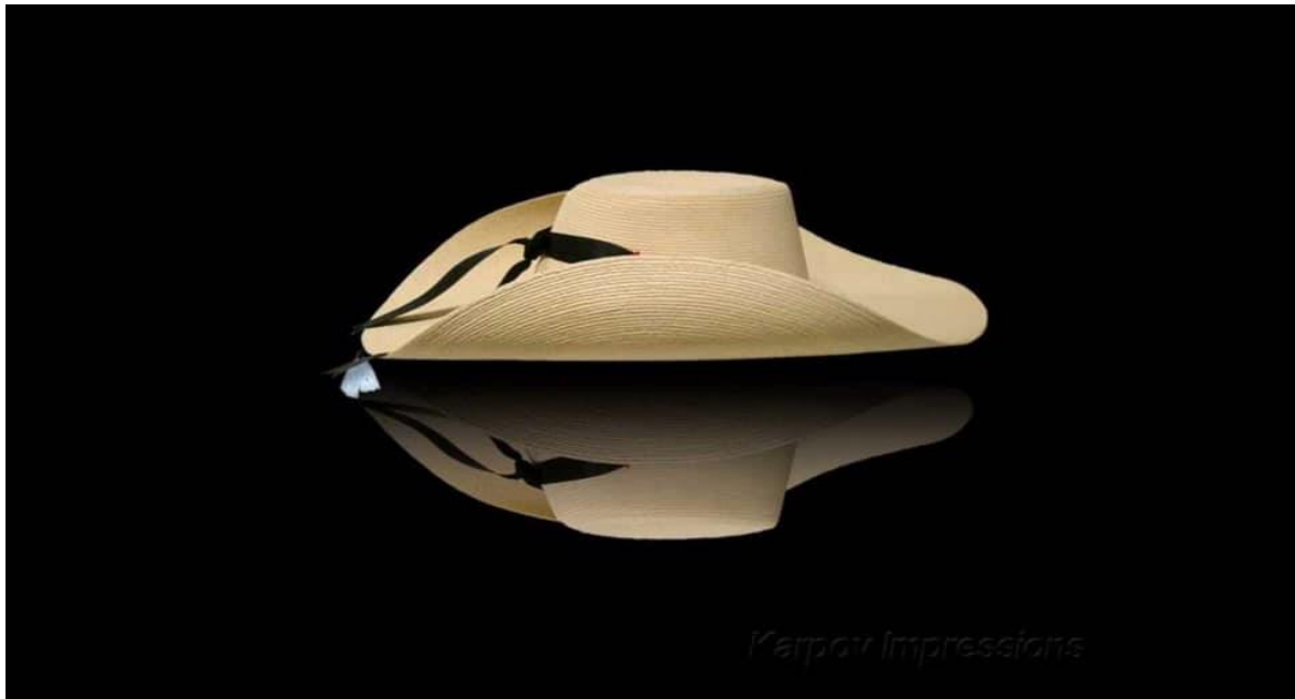
Imagen No.1 Sombrero calentano de Tlapehuala