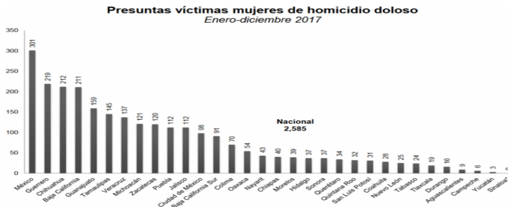
Grafica No. 1 Femicidios Estado de México