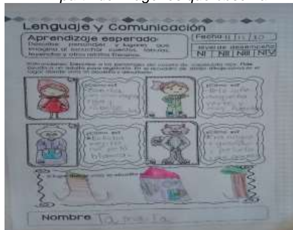
Figura 9. Descripción de personajes de cuentos a partir de imágenes que observa.

En las fotografías se pueden apreciar algunas de las actividades que se trabajaron con los alumnos de tercer grado como parte del Plan de Acción individual a Distancia, en la cual se observa en la Figura 9 a la alumna Tamara quien realizo la descripción de personajes del cuento de caperucita roja a partir de las, haciéndolo a través de un vocabulario apropiado y en la Figura 10 se puede observar el mural que realizo con imágenes que aluden a los hábitos de higiene y salud como parte de su cuidado personal.