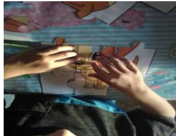
Figura 8. Armandando rompecabezas Para favorecer su percepción geométrica.