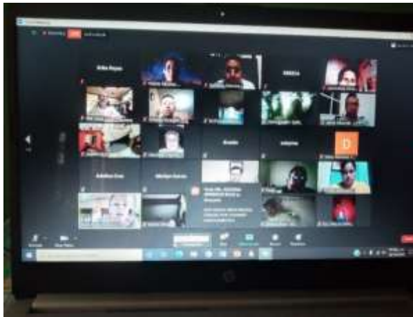
Figura 3. Participación en el curso “Planeación Híbrida”.

Como parte de la nueva modalidad de enseñanza aprendizaje a distancia se requirió que las docentes participaran en cursos en línea sobre habilidades digitales los cuales se aprecian en las fotografías de la Figura 3 y Figura 4, con el propósito de tener conocimiento de las herramientas que se pueden utilizar para llevar acabo la enseñanza con los alumnos a distancia, además de que fue necesario conocer los nuevos términos educativos que atienden a esta nueva modalidad de enseñanza.