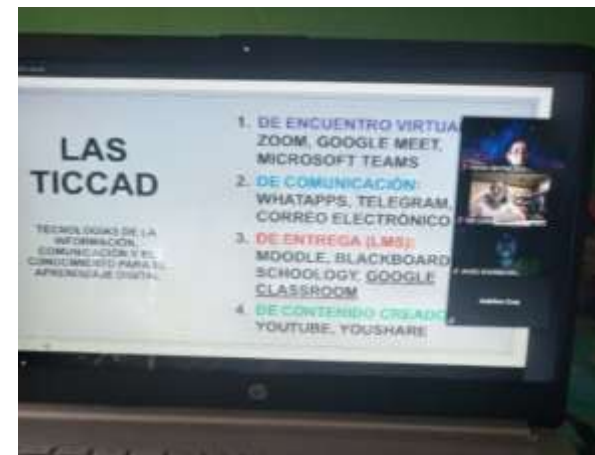
Figura 4. Participación en el curso las “TICCAD”.