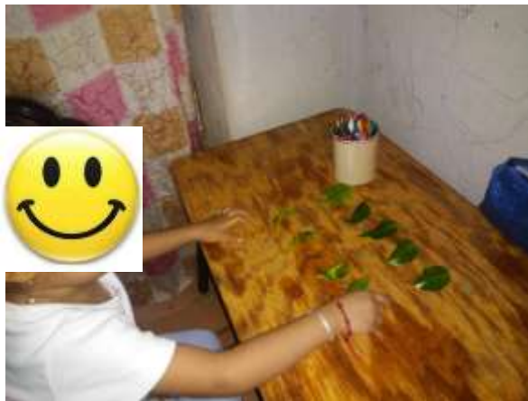
Figura 5. Conteo uno a uno siguiendo la sucesión Numérica del 1 al 10.

En las fotografías se pueden apreciar algunas de las actividades que se trabajaron con los alumnos de primer grado como parte del Plan de Acción individual a Distancia, en la cual se observa en la Figura 5 a la alumna Christi quien trabajo el conteo uno a uno siguiendo la sucesión numérica del 1 al 10 utilizando hojas de árboles que tenía en casa, con lo que logro apropiarse de uno de los principios del conteo y en la Figura 6 se puede apreciar la manipulación de pintura como parte de la producción de obras artísticas en su libro de texto “Mi álbum de Primer Grado”, de forma libre utilizando su creatividad.