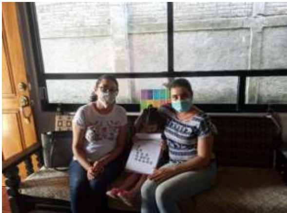
Figura 1. Visita Domiciliaria a una Alumna de Primer Grado.

Las fotografías presentadas en la Figura 1 y Figura 2 son muestra de la realización de visitas domiciliarias que se realizaron por parte de las docentes a los alumnos de la institución donde se estableció un dialogo con las madres de familia así como con los alumnos, para reforzar lo que se ha estado trabajando, atendiendo sus inquietudes con el propósito de brindar las herramientas que permitan al alumno lograr sus aprendizajes.