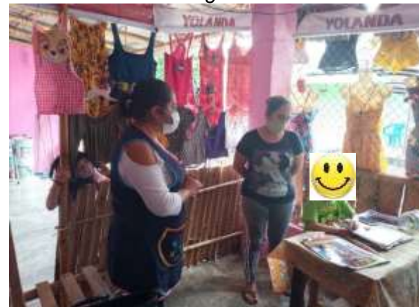
Figura 2. Visita Domiciliaria a un Alumno de Segundo Grado.