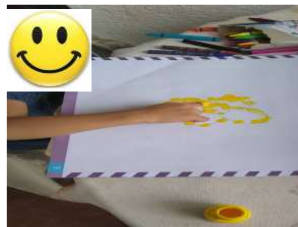
Figura 6. Manipulación de pintura como parte de la Producción de obras artísticas de forma libre.