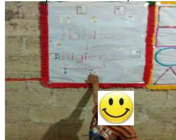
Figura 10. Reconocimiento de hábitos de higiene y salud Como parte de su cuidado personal.