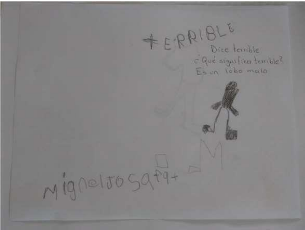
Fig. 7 Desarrollo de la actividad.