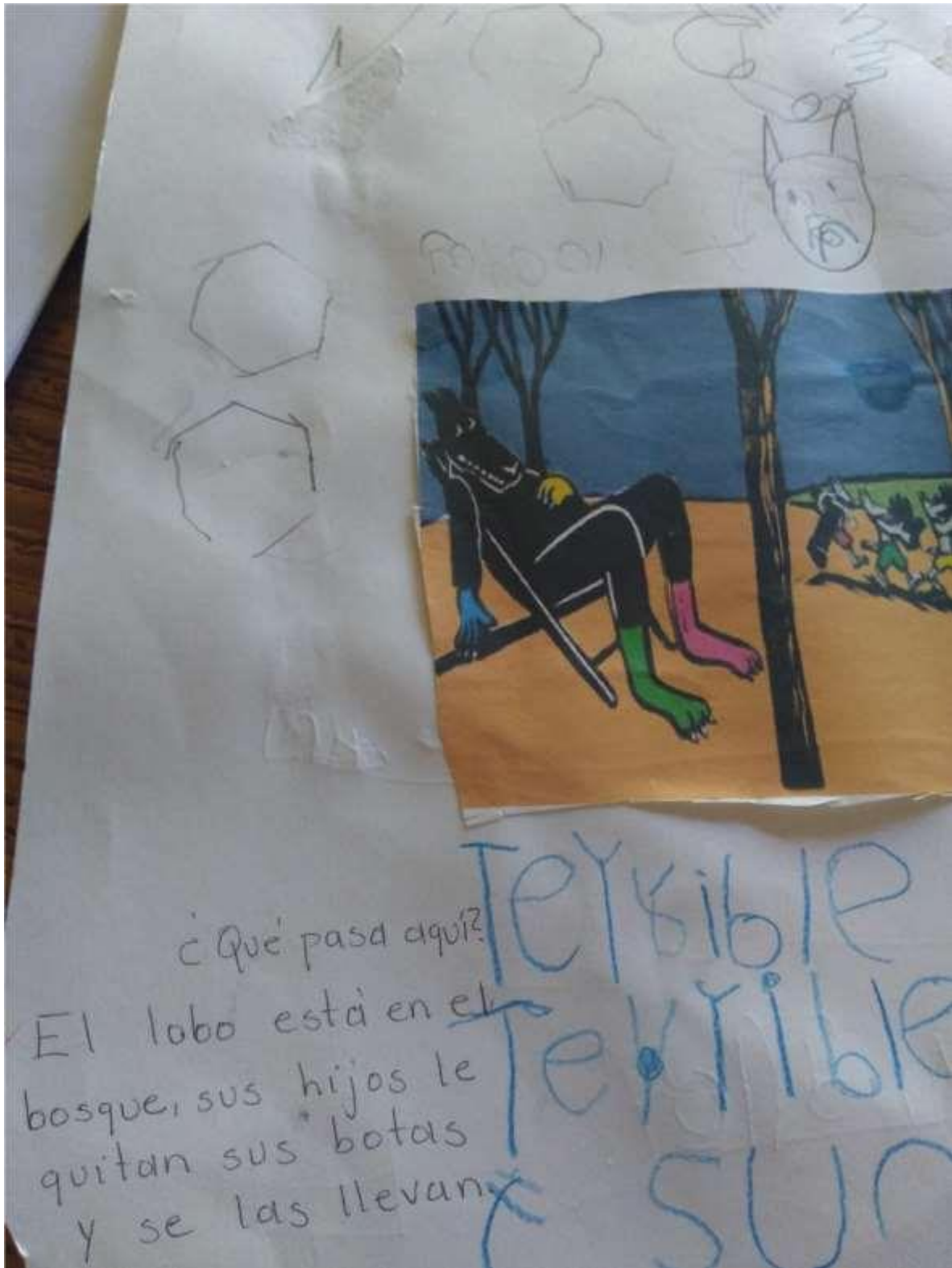
Fig. 8 Desarrollo de la actividad.