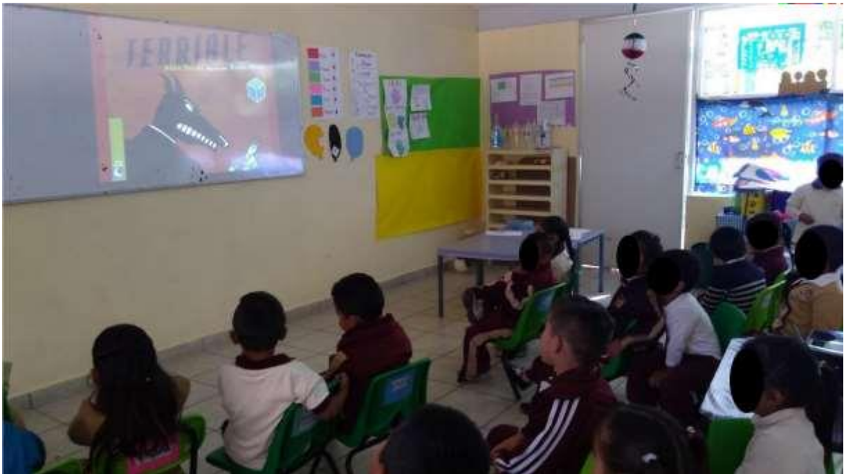
Fig. 5 Desarrollo de la actividad.

Uso de la tecnología para presentar el cuento en diapositivas y se mantuviera el interés para que infirieran sobre el contenido del cuento a partir de la portada