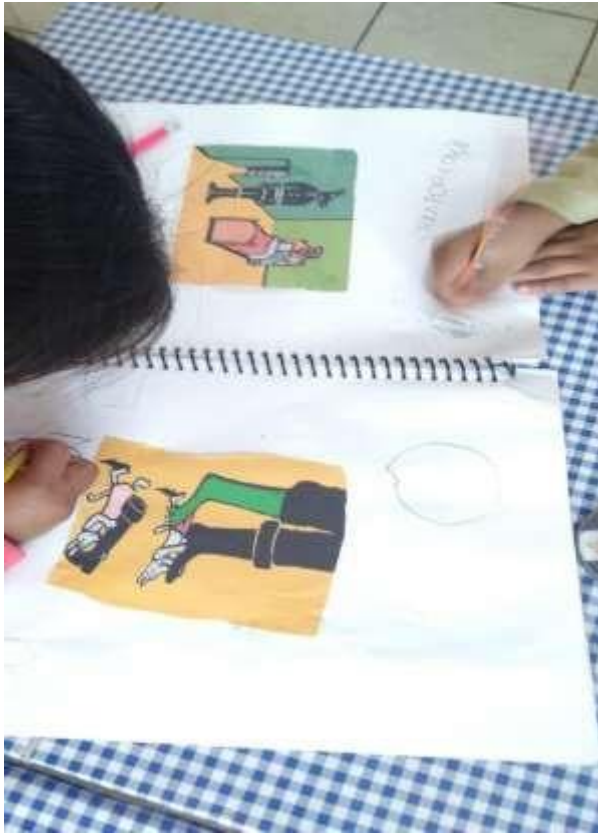
Fig. 3 Desarrollo de la actividad.