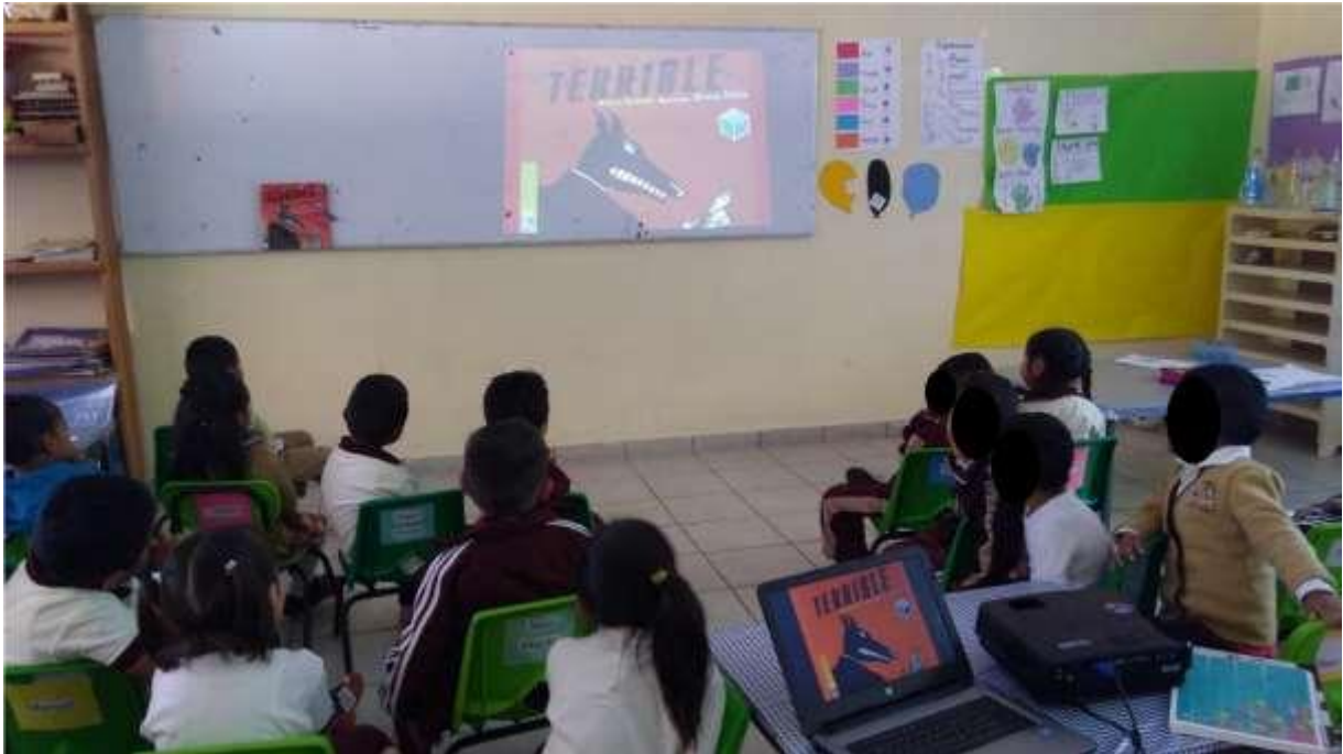
Fig. 9 Desarrollo de la actividad. Se le dio lectura al cuento y los alumnos y alumnas compararon sus inferencias iniciales con el contenido.