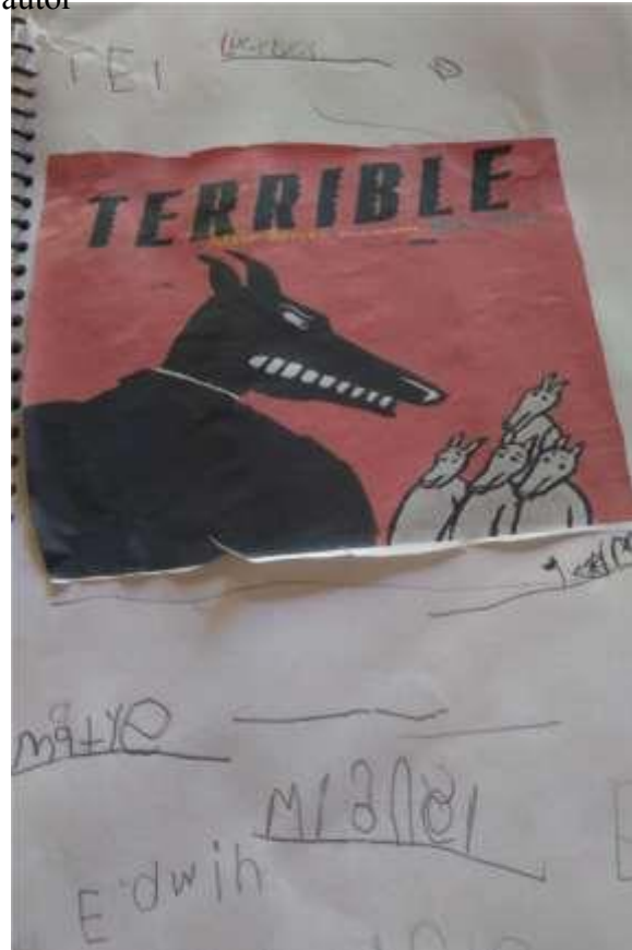
Fig. 4 Desarrollo de la actividad.