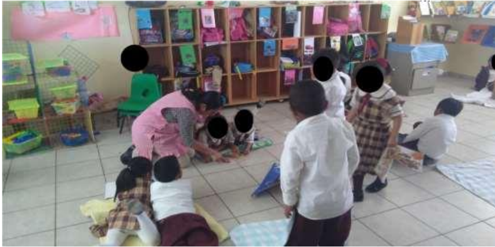
Fig. 1 Desarrollo de la actividad.

Escuchando las inferencias que realizan los alumnos del cuento a partir de las imágenes usando los cuentos de biblioteca de aula y escolar (se está cuestionando a la alumna con discapacidad auditiva)