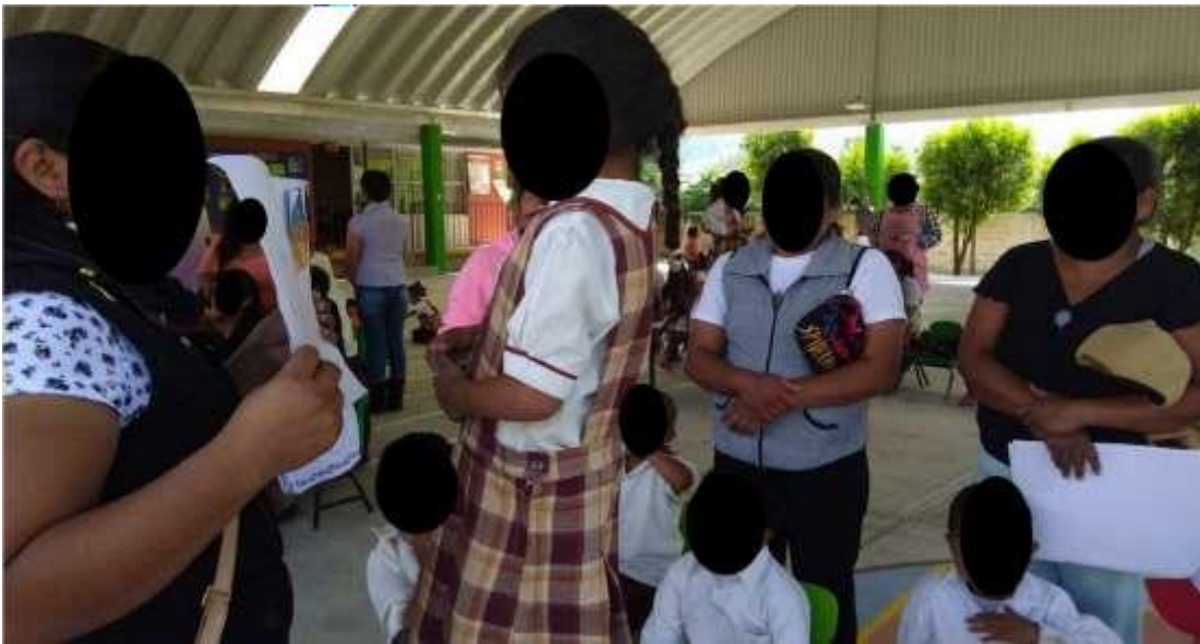
Fig. 2 Desarrollo de la actividad.

Escuchando las inferencias que realizan los alumnos del cuento a partir de las imágenes usando los cuentos de biblioteca de aula y escolar (se está cuestionando a la alumna con discapacidad auditiva)