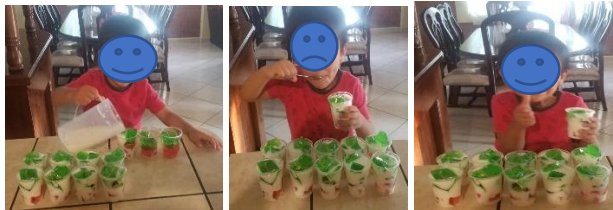
ELABORACIÓN DE LA GELATINA