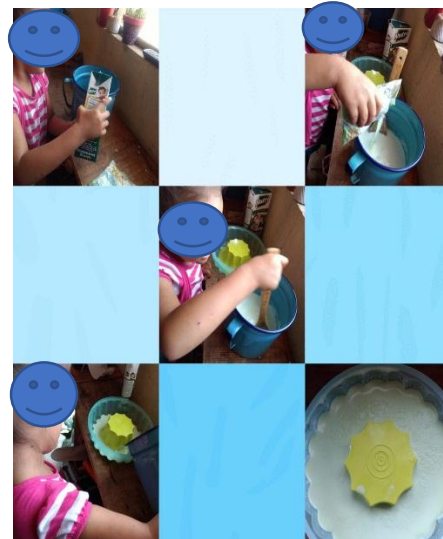
ELABORACIÓN DE LA GELATINA