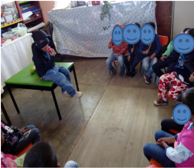
PROBANDO ALIMENTOS DE DISTINTOS SABORES

*Probar alimentos de distintos sabores vendando los ojos a los alumnos y solicitar que digan a que les saben, dulce, salado, amargo, etc. ¿Qué creen que sea lo que están probando?.