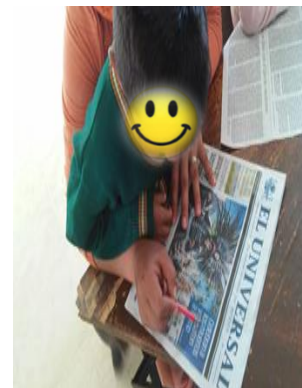
Alumnos aprendiendo sobre las noticias.

Elaboró: Vianey Guadalupe Almazán Monroy