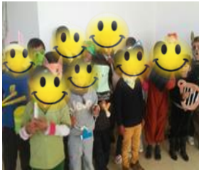
Orquesta en la escuela

Elaboró: Alicson Mildret González González