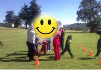
Padres de familia de 1° A, participando

Es el ejercicio físico llevado a cabo por la madre y el hijo(a) o la forma de actividad física en la que se integra la participación activa tanto de la madre o padre o ambos, a través de diversas formas de ejercitación como puede ser la gimnasia, el baile, el juego y la expresión.