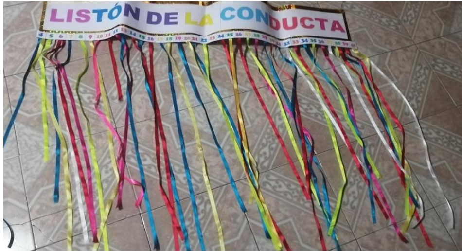
Listón de la conducta, el cual se utilizó para regular el comportamiento de los estudiantes.