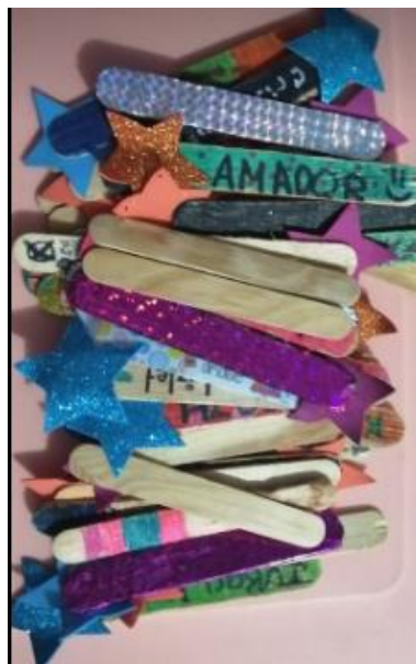
Estrellas para la asistencia y participación de los alumnos.