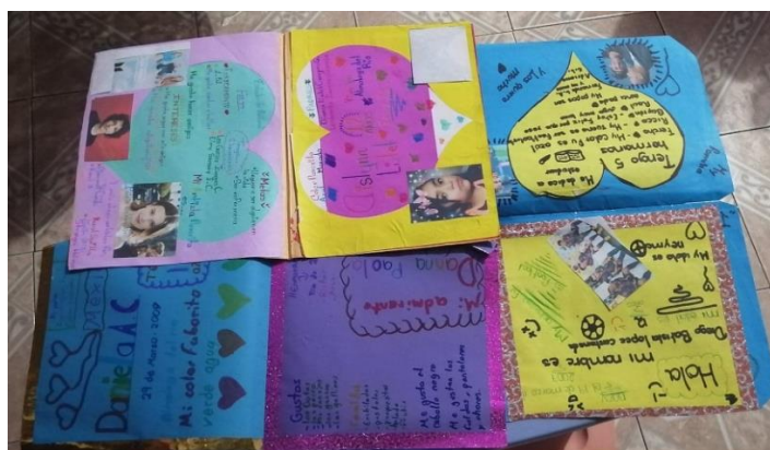
Autobiografía realizada por los alumnos, donde se identificó sus gustos e interés.

Instrucciones: Subraya la respuesta que consideres propia de acuerdo a tu criterio personal.