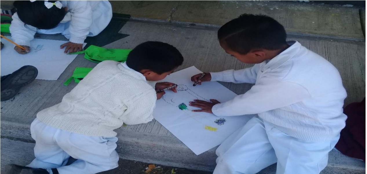
Evidencia fotográfica 4

Situación didáctica: “Celebrando la amistad”, la organización fue por parejas, en donde cada uno dibujo a su compañerito, en relación a como es físicamente, lo que le gusta y disgusta, habiendo uso de la escritura y el dibujo.