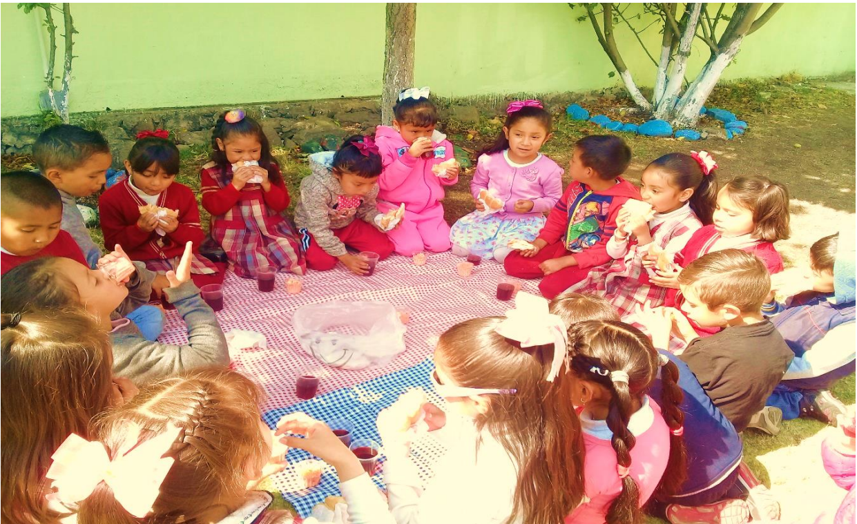
Evidencia fotográfica 14

Secuencia didáctica titulada: “El picnic” los alumnos prepararon los alimentos de manera cooperativa y colaborativa.