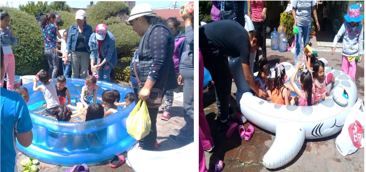
Evidencia fotográfica 12

“Mañana acuática”, en donde los papas e hijos fortalecieron sus habilidades motrices. se creó un ambiente de colaboración y socialización entre ellos.