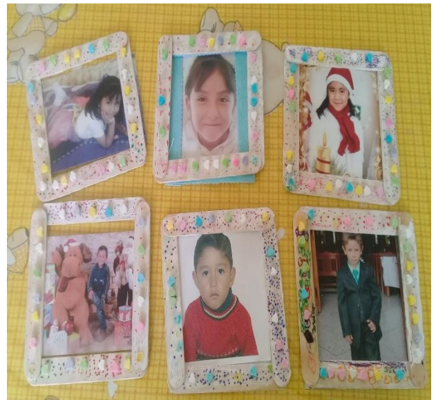
Evidencia fotográfica 5

Situación didáctica: “Celebrando la amistad”, donde se elaboró un portarretratos para su amigo secreto.