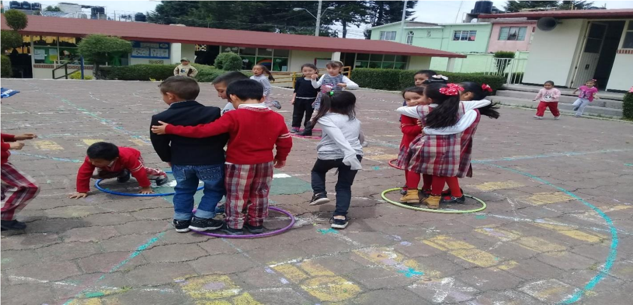
Evidencia fotográfica 9

Actividad titulada: “El barco se hunde”, mediante la estrategia del trabajo colaborativo.