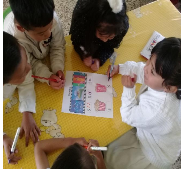
Evidencia fotográfica 7

Situación didáctica titulada: “Restaurante el amigo”, por equipos colocaron el precio que ellos sugerían para cada producto.