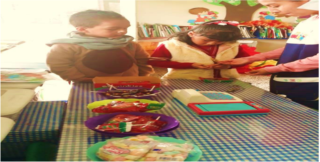
Evidencia fotográfica 11

“La tiendita”, fue una estrategia que sirvió para la regulación de la conducta de los niños.