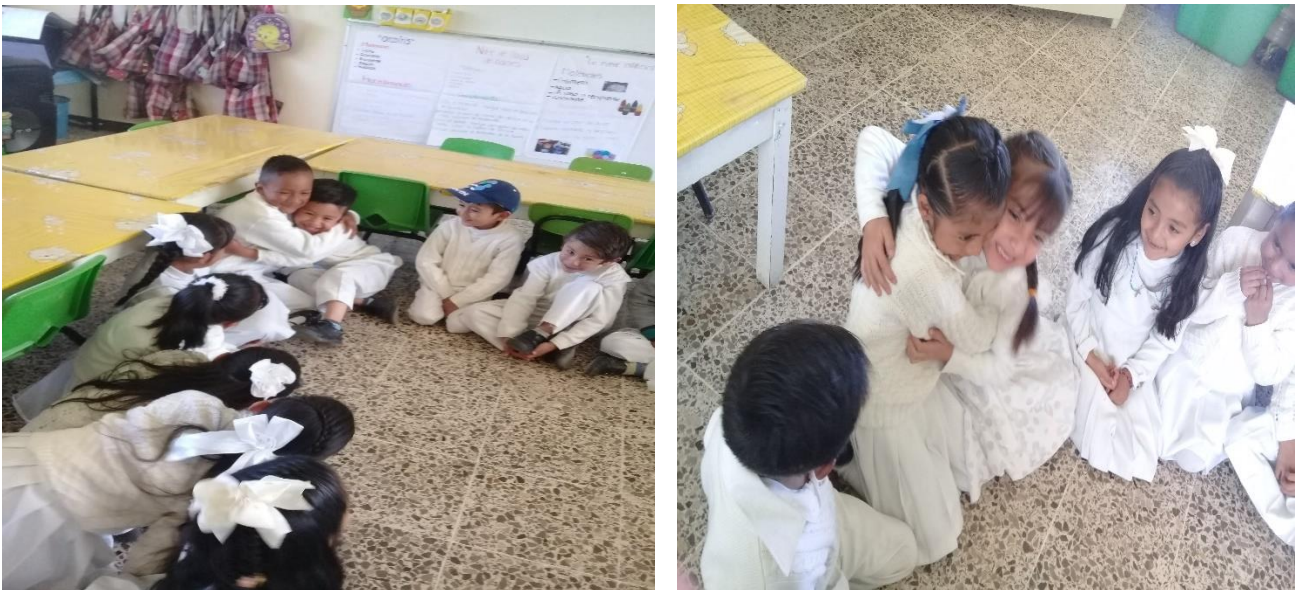
Evidencia fotográfica 10

Actividad titulada: ¿Sabes que es un abrazo?, se realizó con el propósito de que los niños se integran, conocieran y se relacionaran más para una mejor convivencia.