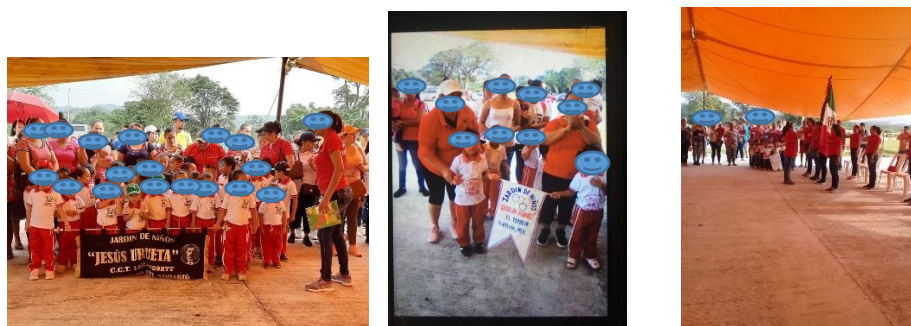
Desfile de entrada