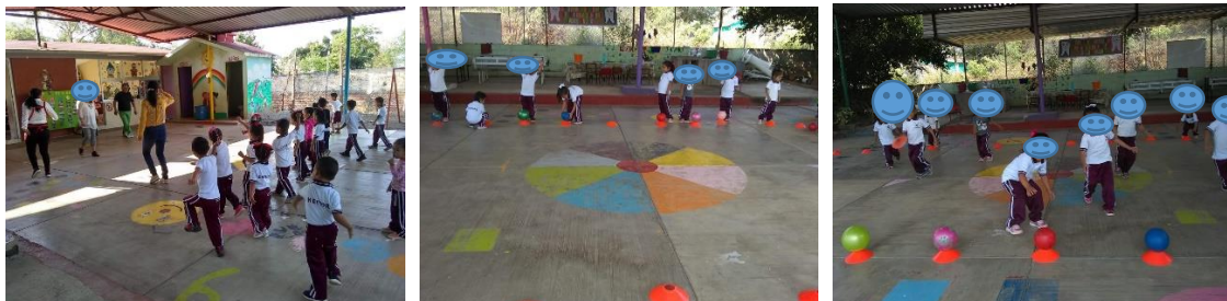
Entrenamiento antes de la mini olimpiada