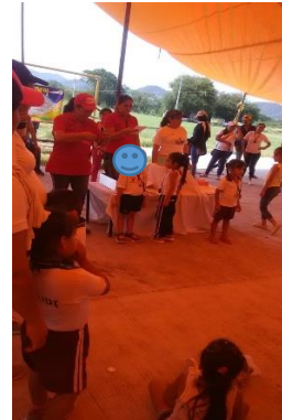
Ceremonia de premiación

LINK PARA VIDEO DE COMPETENCIA DE ATLETISMO