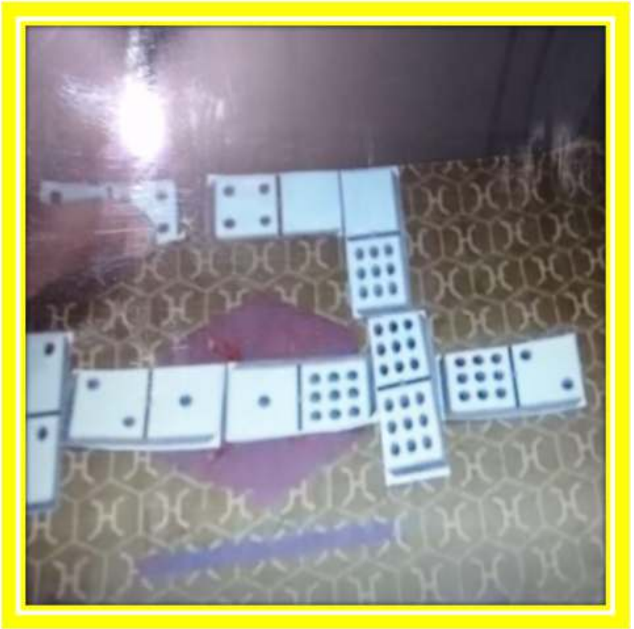
El juego del “domino” útil en el desarrollo del conteo y habilidad mental.