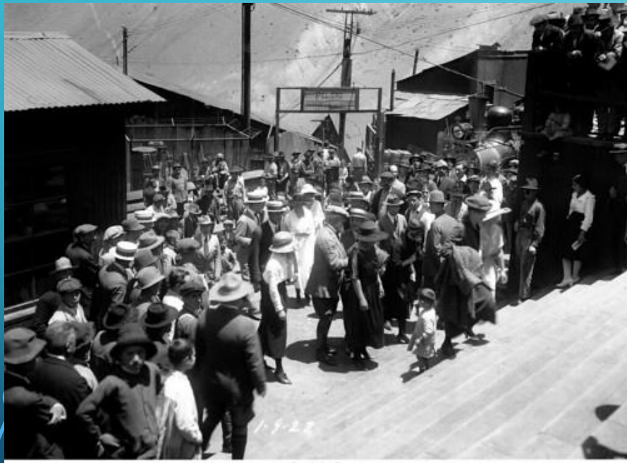
Imágenes históricas de División El Teniente (2014)