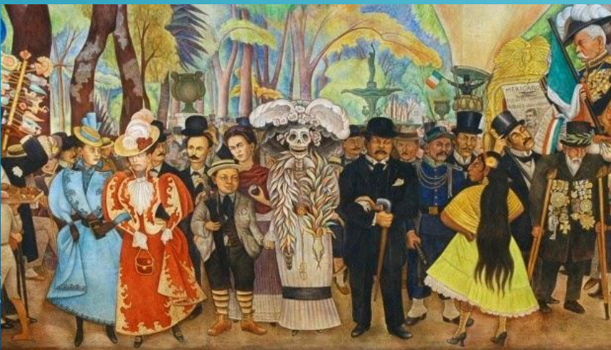
Título desconocido (2015), [Fotografía] de Autor desconocido. Recuperada de http://asomadaenlaventana.blogspot.com/2015/03/la-catrina-senora-de-la-muerte.html CC BY-NC-ND