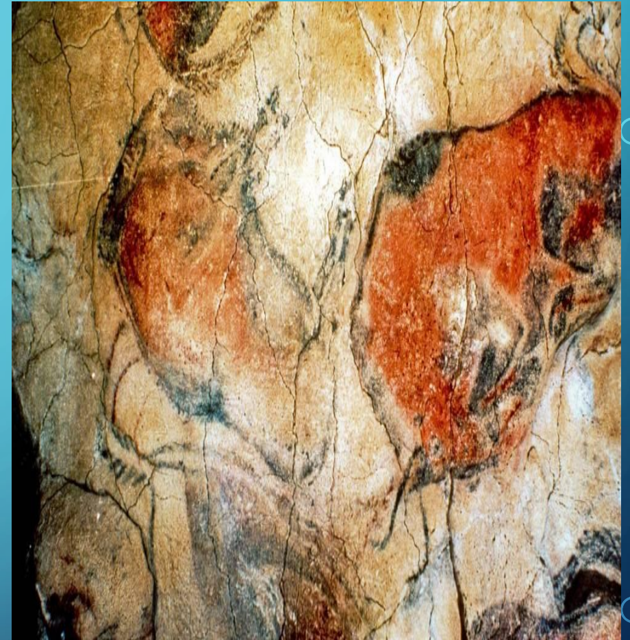
Título desconocido (2017), [Fotografía] de Autor desconocido. Recuperada de https://altmarius.ning.com/profiles/blogs/cantabria-inagotable-descubren-pinturas-rupestres-mas-antiguas-qu CC BY-NC-ND