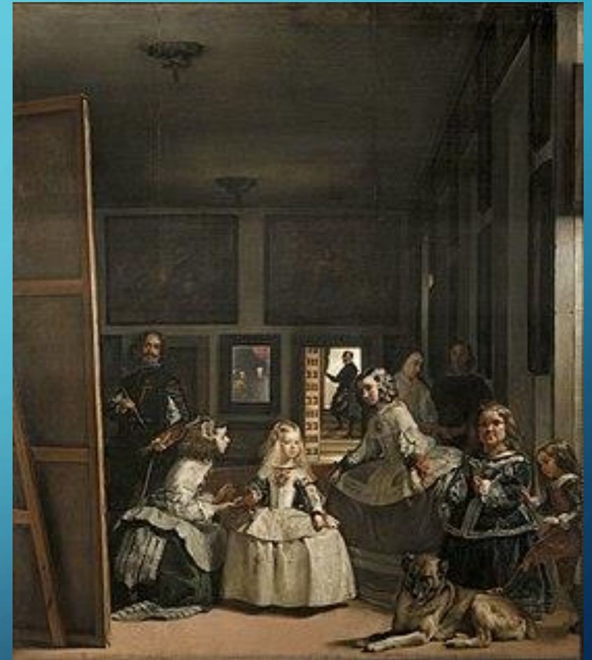
Las meninas (2016) [Pintura] de Diego Velázquez.

Las imágenes estimulan sensaciones como la intensidad, la sorpresa, la conmoción que generan nuevas preguntas y permiten construir nuevos conocimientos en los alumnos.