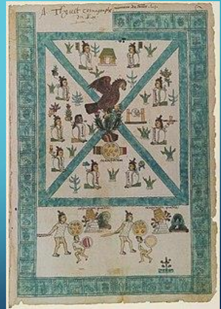
Título desconocido (2008), [Fotografía] de Autor desconocido. Recuperada de https://nn.wikipedia.org/wiki/Aztekarrar CC BY-SA