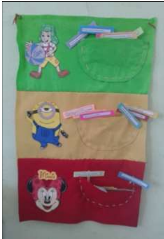
Semáforo de la conducta.