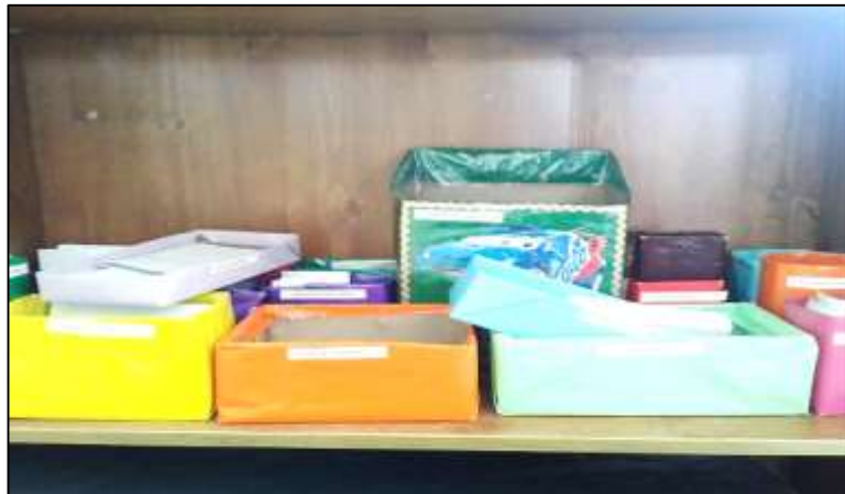
Cajita de los sentimientos.