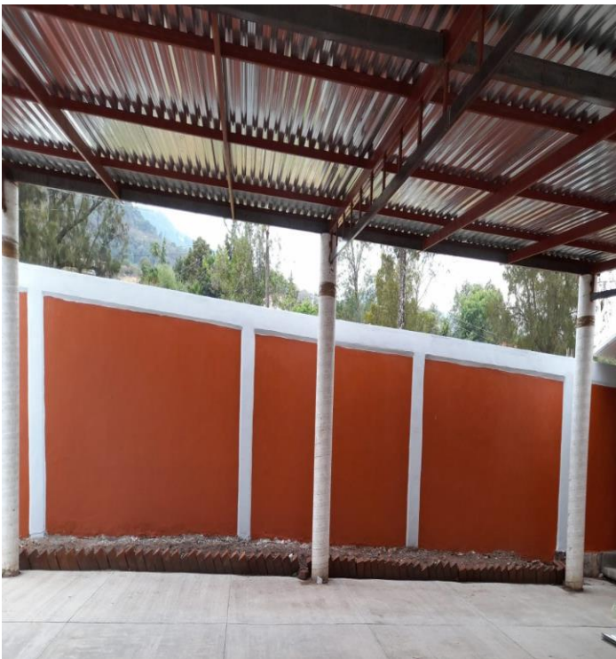
50 m. de barda pintada.

Se pintaron 50 metros de barda, se hicieron dos banquetas pequeñas, se colocaron canaletas en la barda que está enfrente de los baños esto hacia que se metiera el agua a los baños; también se reparó la techumbre del patio cívico, se hizo un techo en la entrada principal y se les dio mantenimiento a los juegos se soldaron y se pintaron.