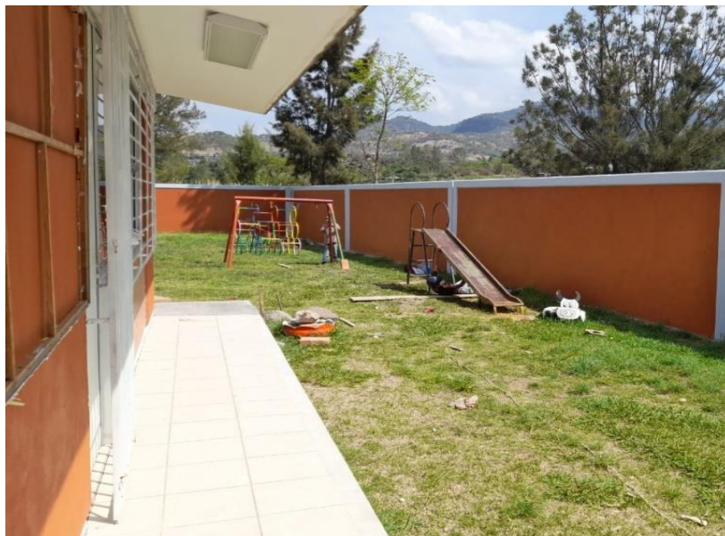
Mantenimiento a los juegos

Hoy que veo cómo se encuentra la escuela me siento satisfecha por ese gran trabajo que se realizó entre padres de familia y directora escolar, nos damos cuenta que todo ese tiempo dedicado valió la pena ya que la escuela se encuentra en óptimas condiciones.