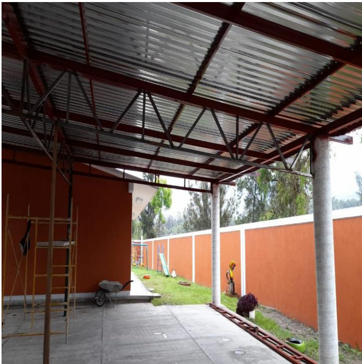
Reparación de techumbre