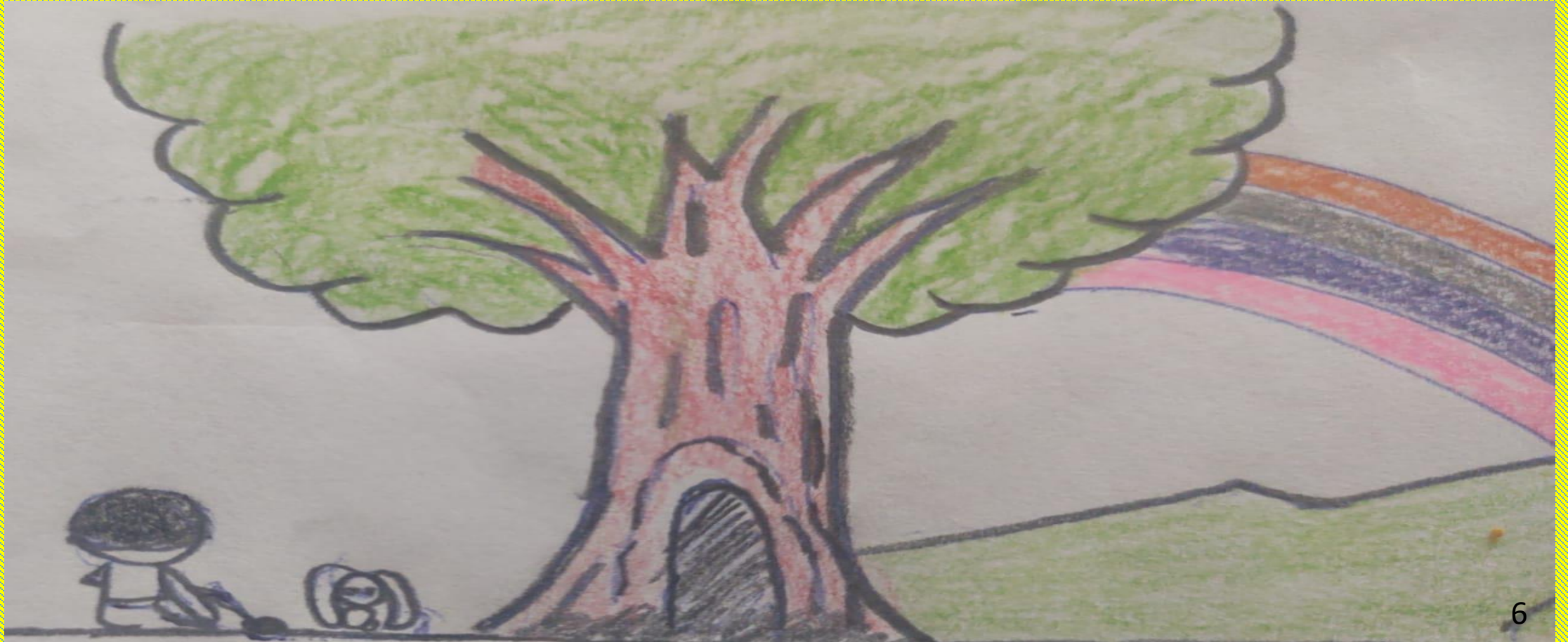
Fotografía original del autor