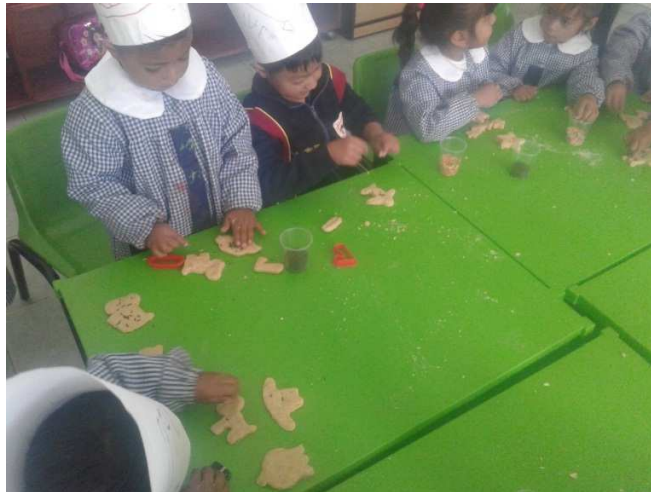
Los niños decoraron con chispas de chocolate las galletas que habían elaborado con su masa.