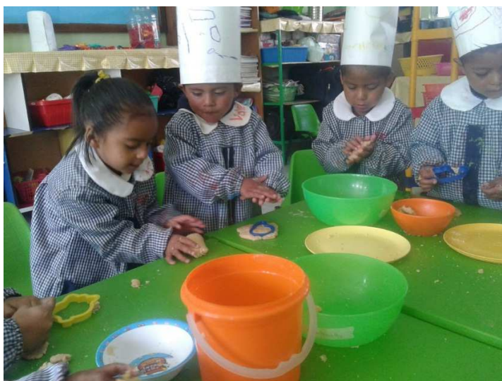
En el momento de cortar las galletas los niños se apoyan entre sí haciéndose recomendaciones sobre como cortarlas, aprovechar la mas arestante y volver a amasar si era necesario.