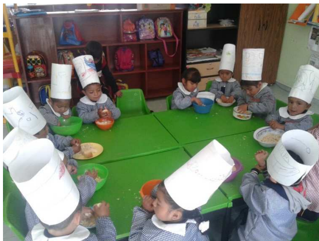
Los niños revuelven leche condensada con pan molido para obtener una masa con la cual posteriormente harían galletas.