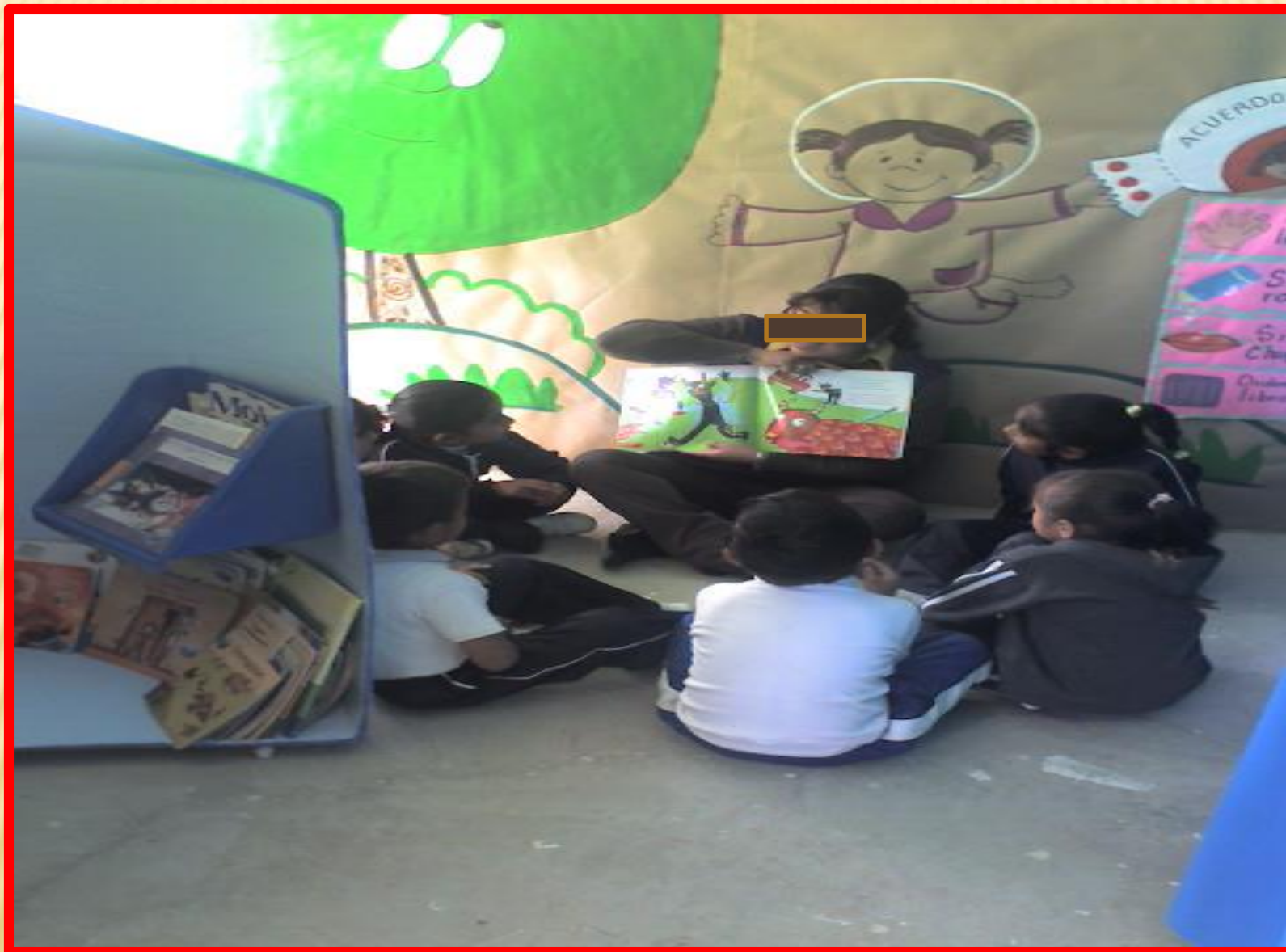
Evidencia del trabajo de los alumnos